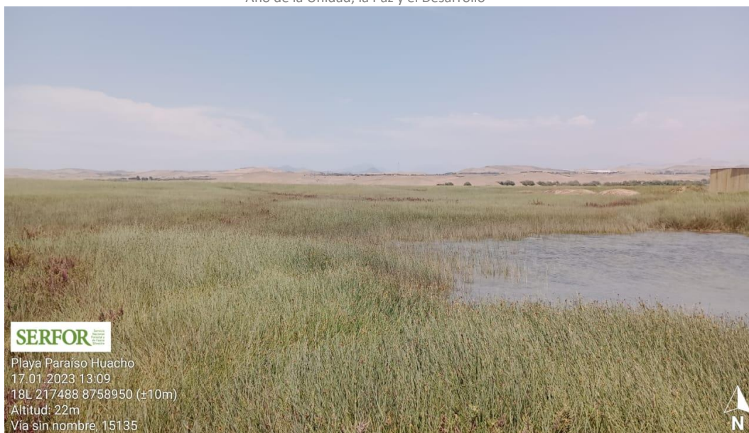
Foto N 02. Vista del P03 se observa área regeneradas naturalmente

"Año de la Unidad, la Paz y el Desarrollo"