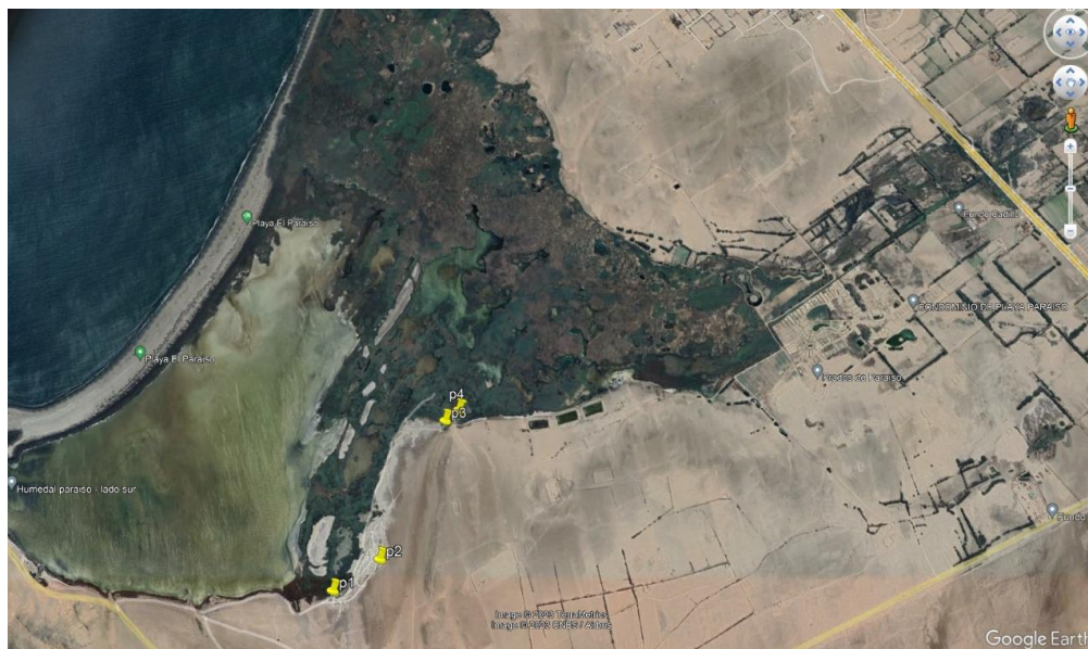
Imagen N 02. Puntos del recorrido durante inspección ocular

Av. Javier Prado Oeste N° 2442 Urb. Orrantía, Magdalena del Mar – Lima 17 T. (511) 225-9005 www.gob.pe/serfor www.gob.pe/midagri