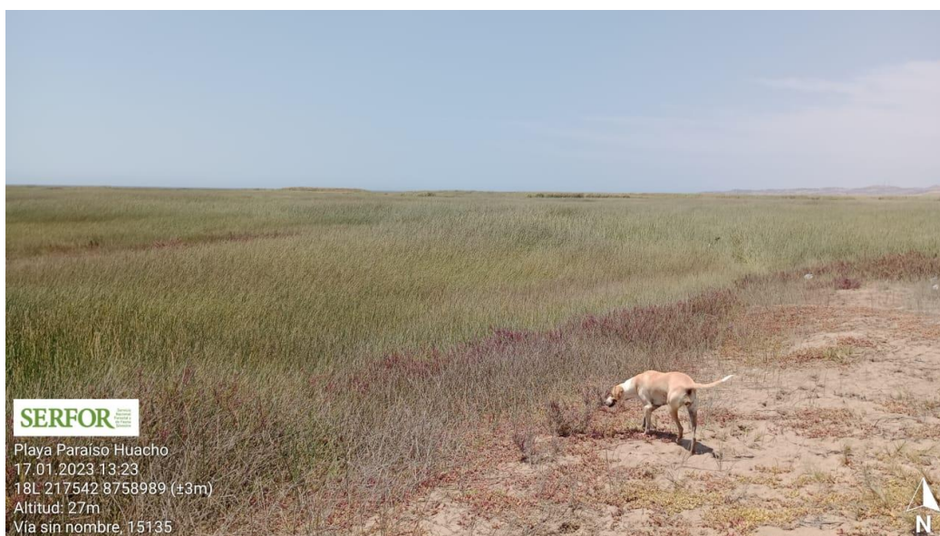
Foto N 04. P03 áreas con abundante vegetación acuática emergente

"Año de la Unidad, la Paz y el Desarrollo"