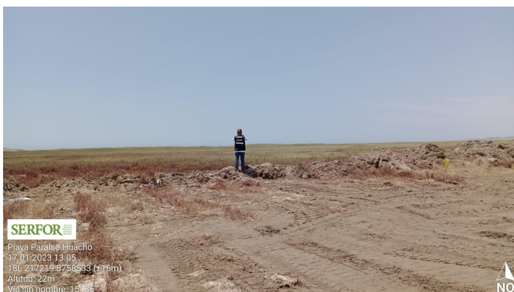
Foto N 01. P02 áreas en crecimiento al lado del camino