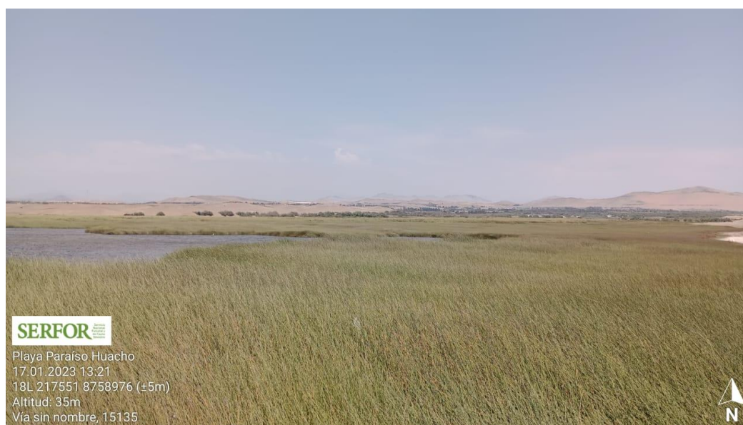
Foto N 03. P03 áreas con abundante vegetación acuática emergente

Av. Javier Prado Oeste N° 2442 Urb. Orrantia, Magdalena del Mar – Lima 17 T. (511) 225-9005 www.gob.pe/serfor www.gob.pe/midagri