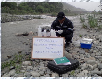
Monitoreo Río Chancay-Huaral altura puente Palpa