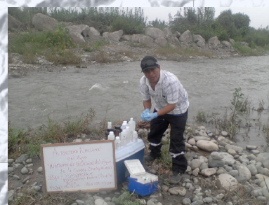
Monitoreo Río Chancay-Huaral altura puente Boza