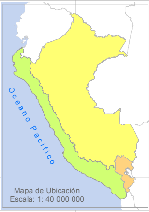
Ambito Cuenca de la Chancay-Huaral