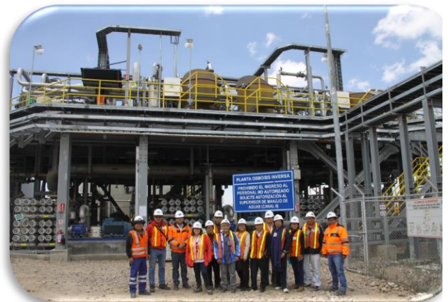
Planta Osmosis Inversa