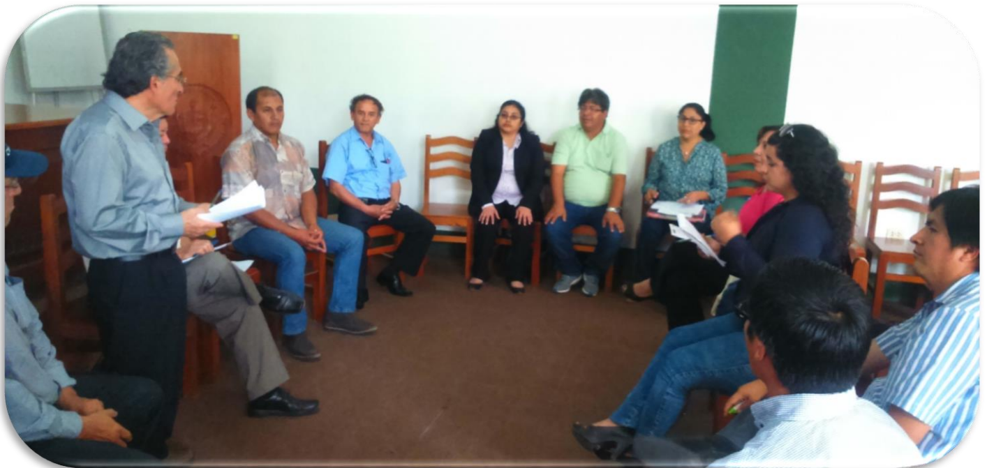
Gerentes Regionales del Ambiente y Agricultura, durante reunión de trabajo de la Comisión Técnica Regional para la implementación del Plan Regional de Reforestación 2011 - 2021

El ambiente, el desarrollo económico sostenible y la mejora en la calidad de vida de las personas, se ve garantizado con el avance en el proceso de reforestación que se viene realizando en La Libertad, en el marco del Plan Regional de Reforestación 2011 – 2021 y que es impulsado por la Comisión Técnica conformada para su implementación.