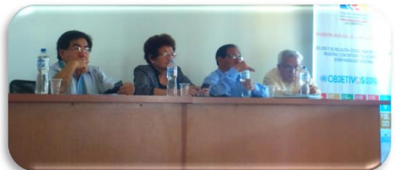
El Panel Los ODS y su relación con el Plan de Desarrollo Regional Concertado y el Acuerdo de Gobernabilidad Regional