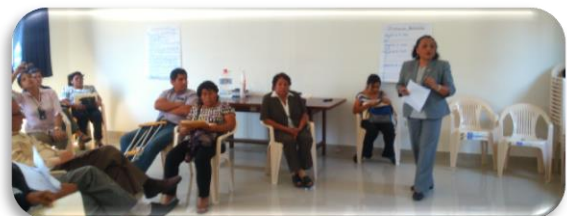
La GRAMB participó como comentarista de la Dimensión Ambiental del grupo encargado de analizar y comparar los ODS y su relación con el Plan de Desarrollo Regional Concertado y el Acuerdo de Gobernabilidad Regional.

El segundo día, los asistentes fueron capacitados en Seguimiento concertado, Trabajo sobre el gasto público, Ejecución presupuestal y otros, vinculado a Alertas y gestión pública regional y local.