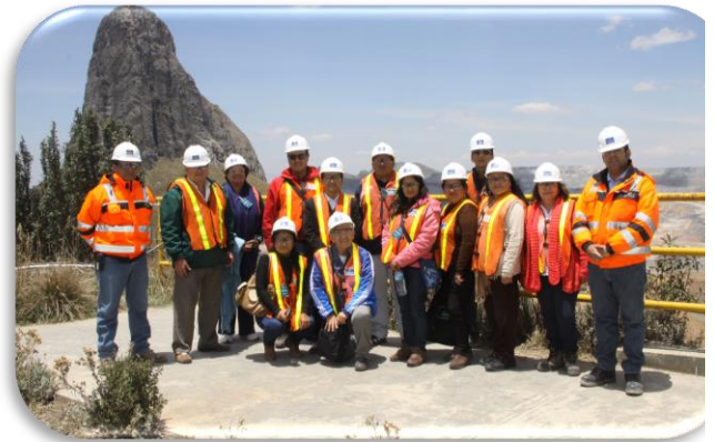
En el mirador Distpach

Finalmente, se visitó el Rancho Minero y Piscigranja, ambos ubicados cerca de las pozas de lixiviación, donde se pudo observar la crianza de ganado vacuno, alpacas y ganado menor. La Piscigranja, es el centro demostrativo de producción y reproducción de trucha arco iris, que evidencia la conservación de la calidad de las aguas de la Laguna Negra, ubicada dentro de la mina.