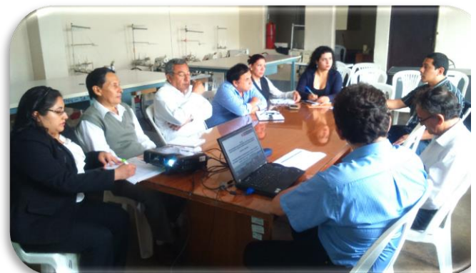
Especialistas de Gerencias convocados a la presentación del PLANGRACC-A