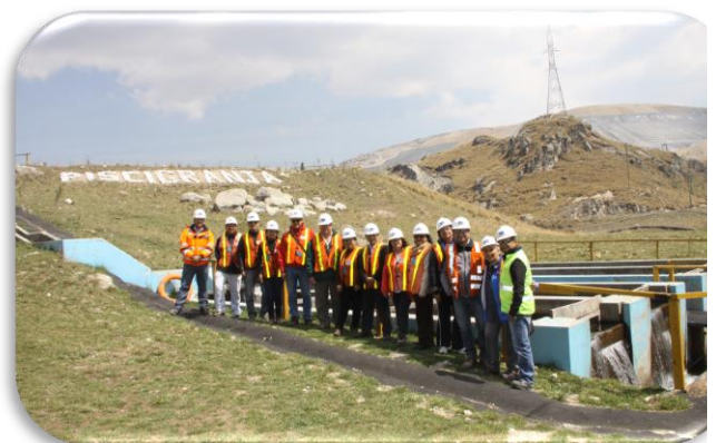
Rancho Minero y Piscigranja