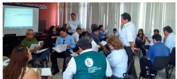
Taller para recoger propuestas de proyectos de inversión