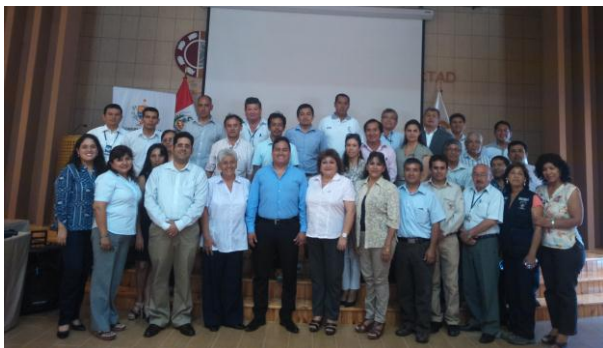
Reunión de trabajo de la Comisión Ambiental Regional de La Libertad