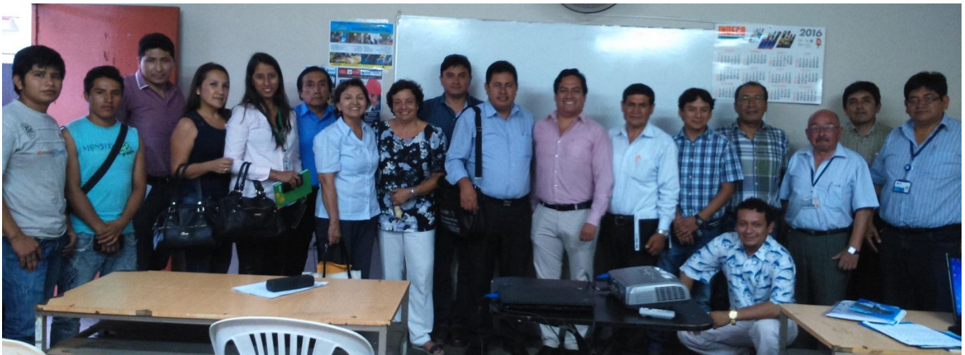
Grupo técnico de gestión ambiental de la Laguna de Piás, acompañados de los consejeros regionales por las provincias de Pataz y Sánchez Carrión