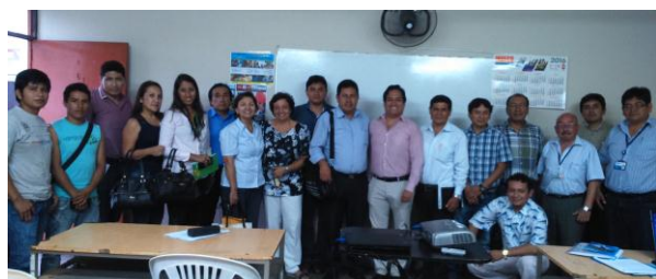
Grupo Técnico de Gestión Ambiental de la Laguna de Piás