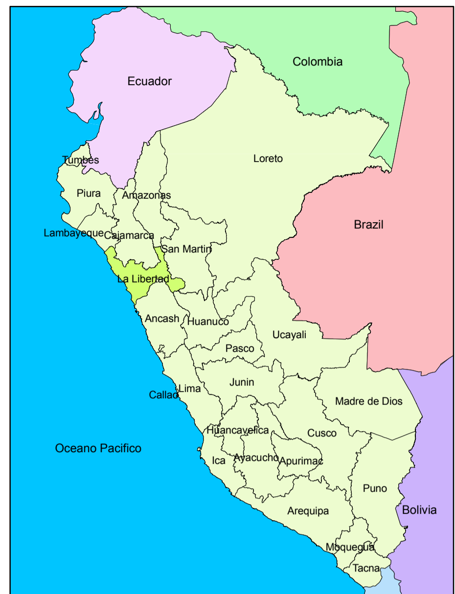
MAPA DE UBICACION