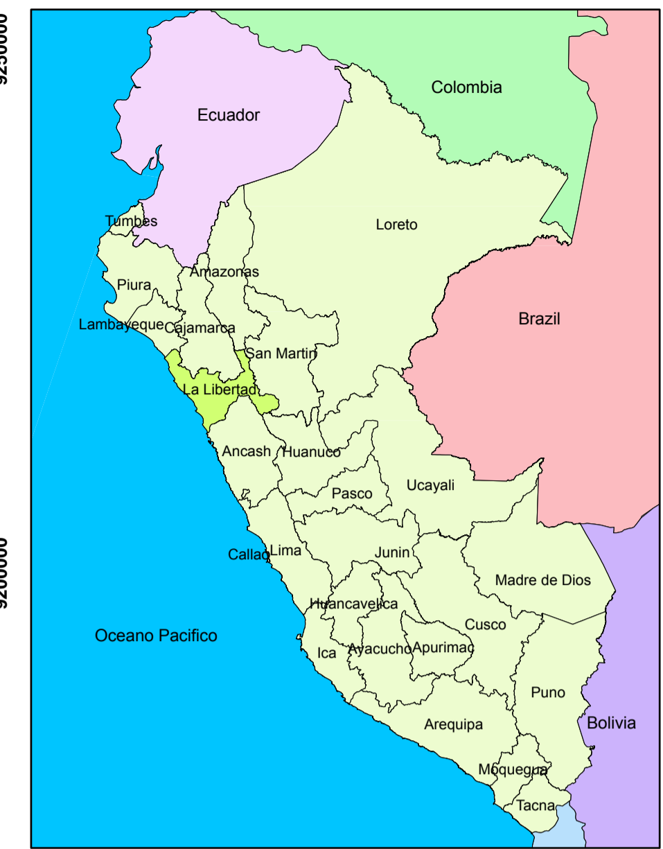
MAPA DE UBICACION