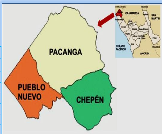
GRAFICO N° 1