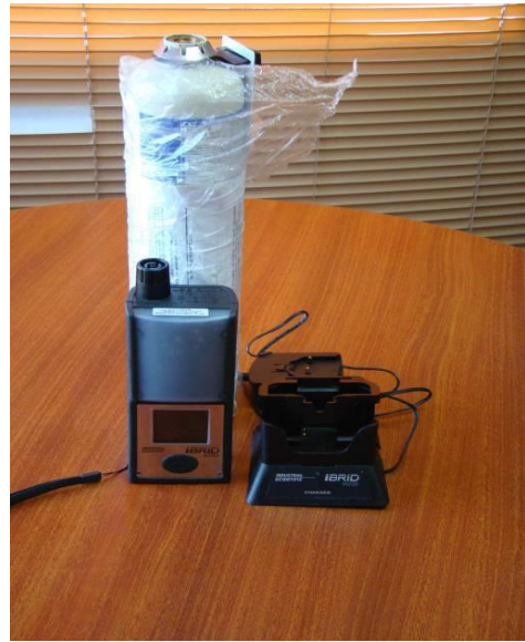
Medidor de COV