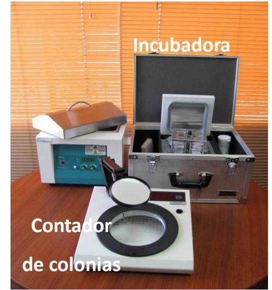
Analizador Microbiológico Portátil