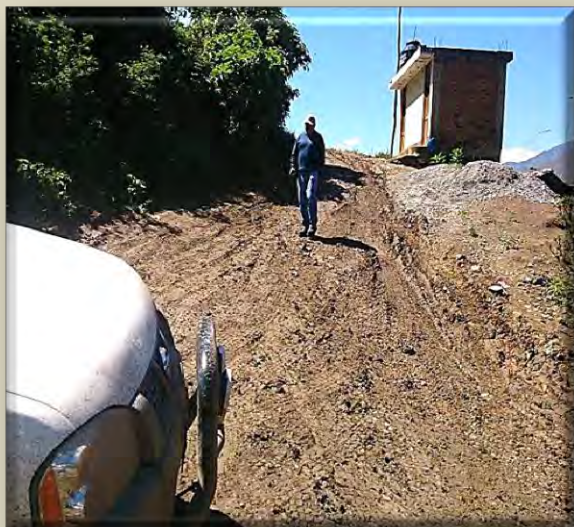
Carretera interrumpida por los residuos de explotación de la minería carbonífera y un huayco.