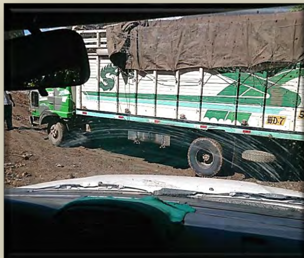
Una de las unidades de transporte pesado que realizan el transporte del carbón mineral.