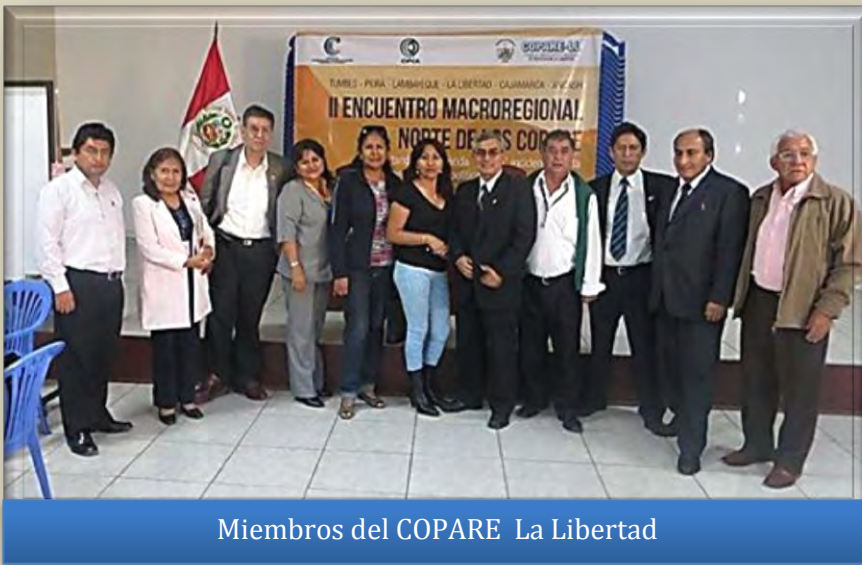
Miembros del COPARE La Libertad