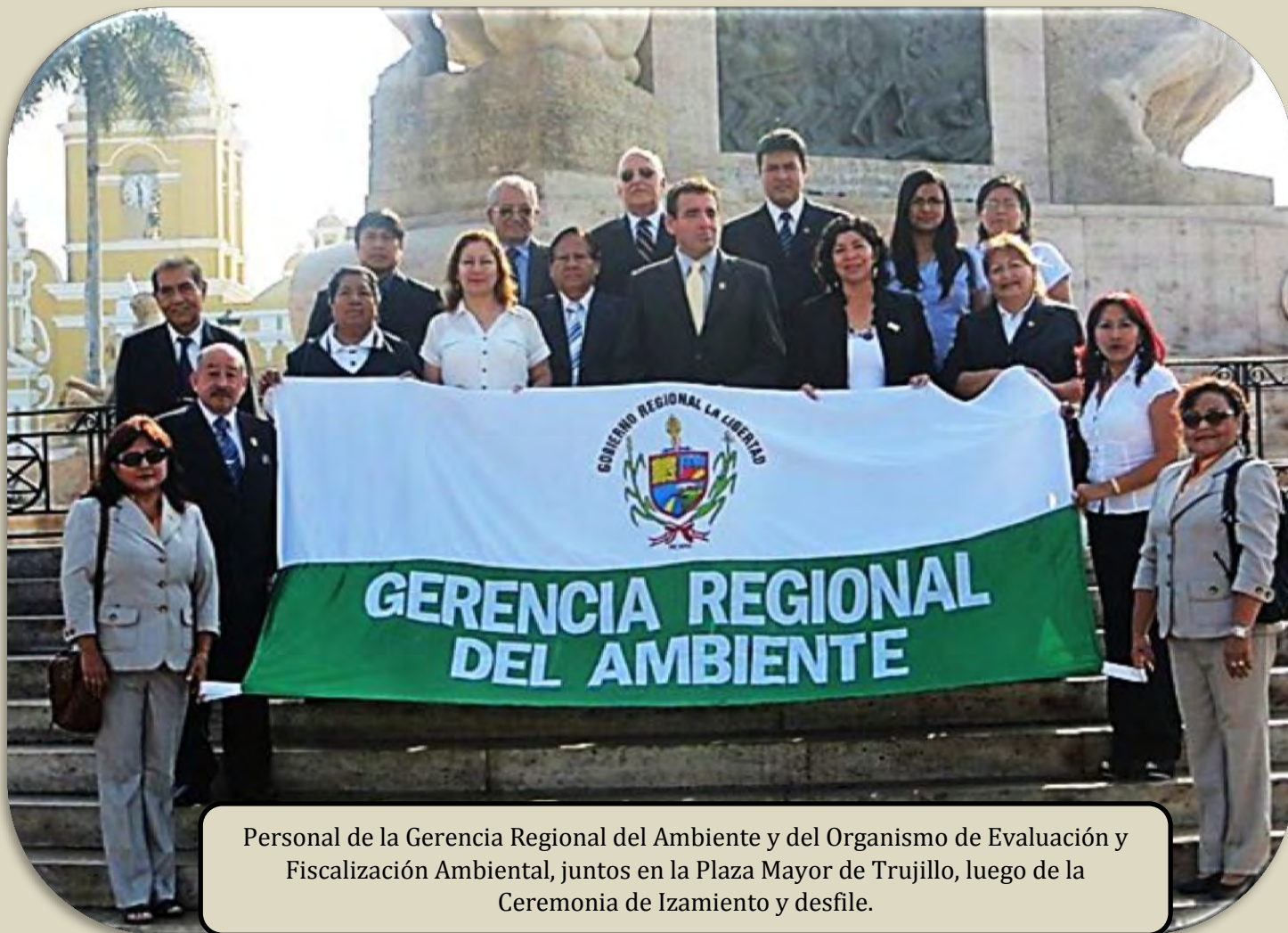
Personal de la Gerencia Regional del Ambiente y del Organismo de Evaluación y Fiscalización Ambiental, juntos en la Plaza Mayor de Trujillo, luego de la Ceremonia de Izamiento y desfile.