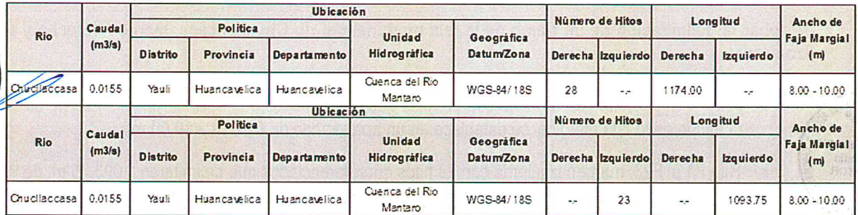
Cuadro N° 02: Hitos georeferenciados del Tramo F1 – F28 de la faja marginal, margen derecha del río Chucllaccasa.