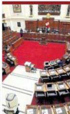
En debate en el pleno.

del Reglamento del Congreso no se puede presentar una propuesta idéntica a otra ya rechazada. Sin embargo, en noviembre del 2022 sí aprobaron un proyecto idéntico en forma y fondo que ya había sido rechazado sobre la Derrama Magisterial.