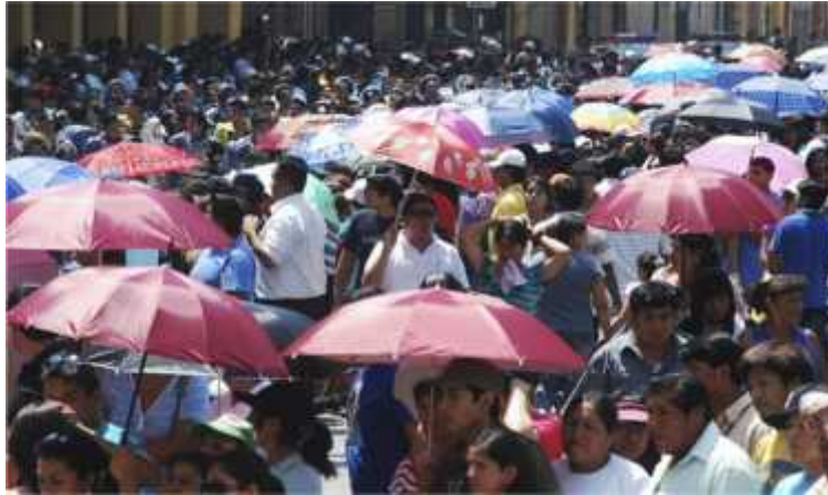
CUADRO DE INTERPRETACION Y LECTURA DE NIVELES DE RADIACION ULTRAVIOLETA