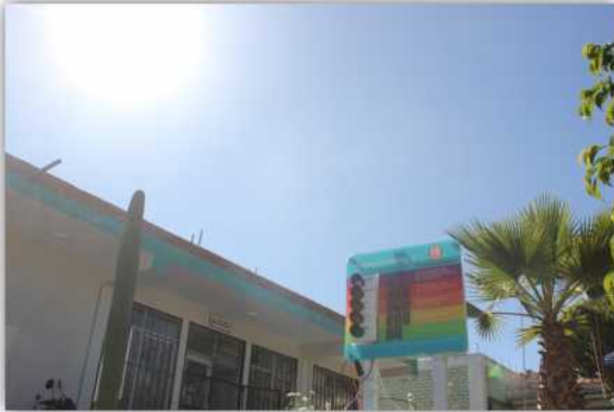
Foto N° 01. Radiación ultravioleta en la ciudad de Huamanga – Ayacucho.