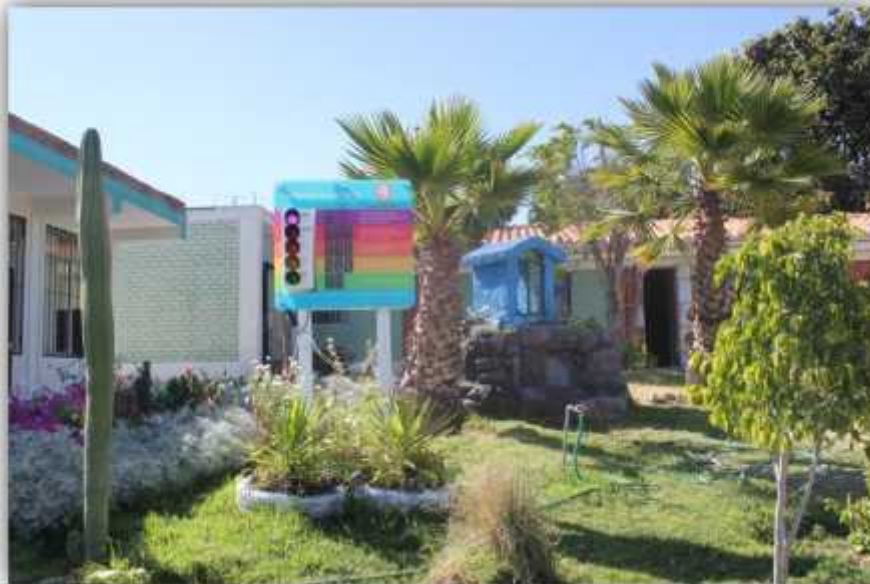
Foto N° 02. Solmáforo instalado en la Gerencia de Recursos Naturales.