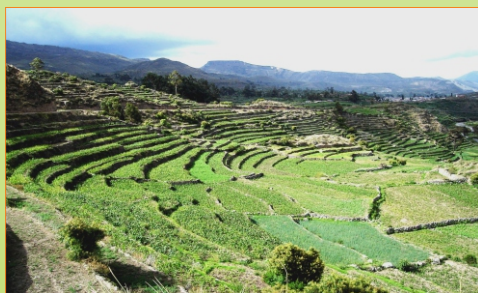
Andenería Andamarca Lucanas

SI, la ZEE ayuda a prevenir y gestionar los conflictos socioambientales al brindar información técnica que permite concertar políticas y estrategias sobre el uso de los recursos sostenible de los naturales y la ocupación del territorio.