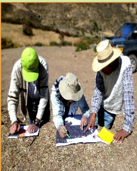
Visita y contrastación en campo - Equipo Técnico ZEE.