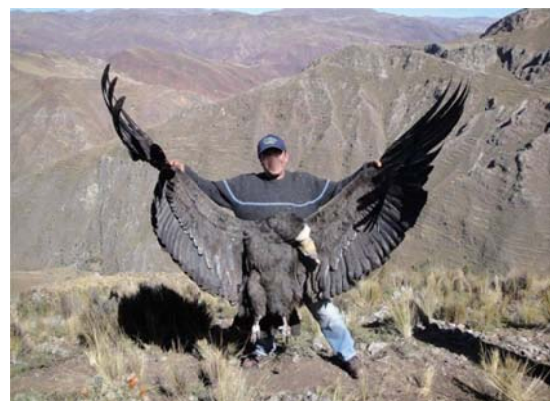
Condenable e irresponsable Caza Furtiva