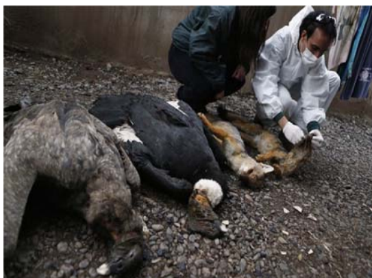
Posible muerte de cóndores por intoxicación y envenenamiento