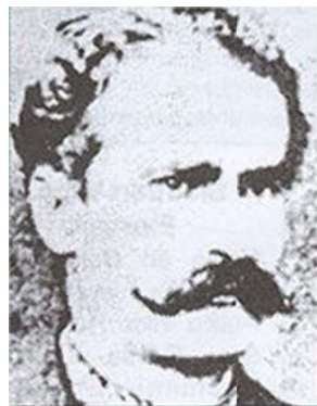
Coronel Víctor Fajardo.

La provincia fue creada el 14 de noviembre del año 1910, en el segundo mandato presidencial del Augusto B. Leguía, por ley N° 1306, el 14 de noviembre de 1910. Se dio a la nueva provincia éste nombre como homenaje al coronel Víctor Fajardo, vencedor en la batalla de Tarapacá, librada el 27 de noviembre de 1879, entre las fuerzas peruanas y chilenas. Este jefe murió heroicamente en la batalla del Alto de la Alianza, entre las mismas fuerzas, el 26 de mayo de 1880.