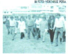
Para reconstruir hospital