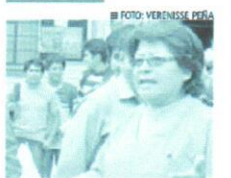
Sindicalista pide solución