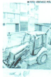
Al fin ejecutan obra