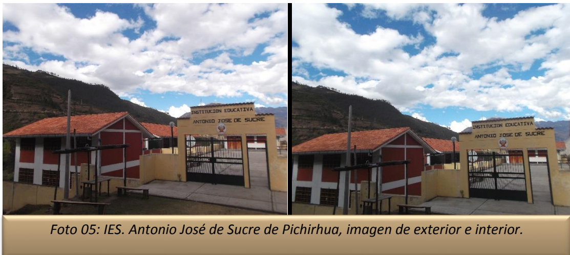
Foto 05: IES. Antonio José de Sucre de Pichirhua, imagen de exterior e interior.