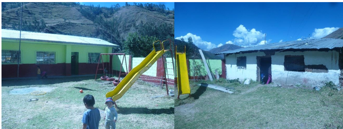
Foto 03: IEI Nro. 215 del barrio Ocrabamba Pichirhua, ambiente pedagógico y cocina

mala ubicación. Otro ambiente con que cuenta esta institución es la cocina que se encuentra en malas condiciones con piso de tierra, sin ventanas.