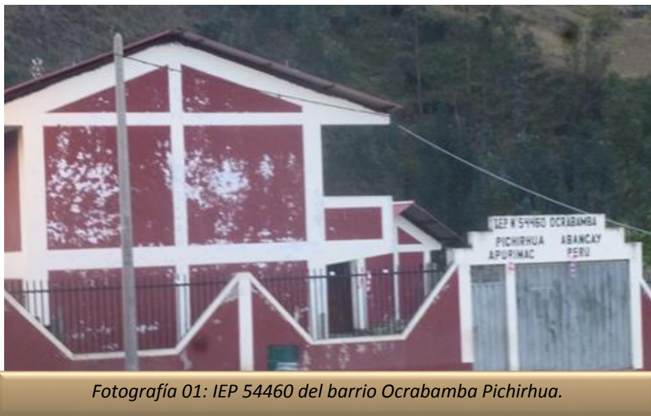
Fotografía 01: IEP 54460 del barrio Ocrabamba Pichirhua.