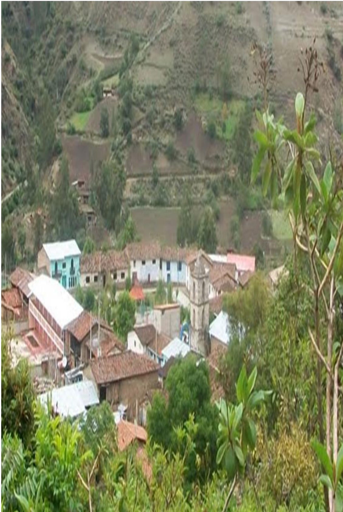
Comunidad Campesina de Pichirhua-Lambrama- Abancay

Reconocida R.051-77-OAJAF-ORAMS en fecha 04 de febrero de 1977