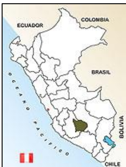
Figura N°1: Departamento: Apurímac