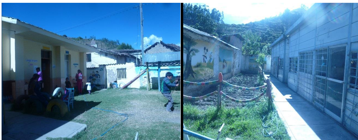
Foto 04: IEI Nro. 47 de Pichirhua imágenes de la cocina, paredes de cerco perimétrico y aulas prefabricadas.

La infraestructura como la pared de cocina y servicios higiénicos está construidos de adobe acabado y se encuentran operativos. Las aulas enseñanza son de material prefabricado y se encuentran en buenas condiciones, las paredes del cerco están construidos de adobe y presentan rajaduras y deterioro.