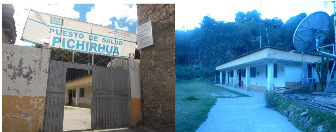
Foto 06: Instalaciones del puesto de salud de Pichirhua y Ocrabamba