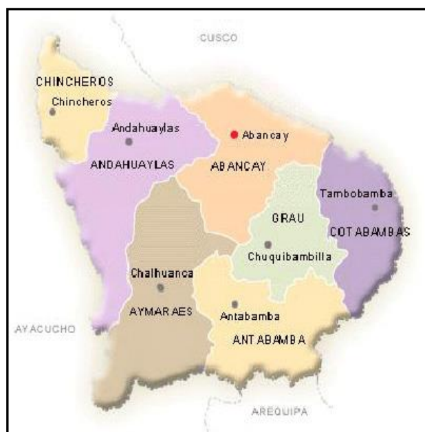
Figura N°02: Región y Provincia