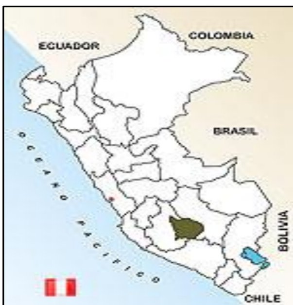
Figura N°01: Mapa del Perú