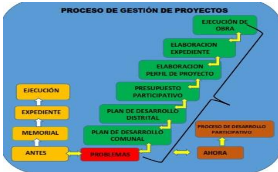
Grafico N° 02: Proceso de Gestión de Proyectos