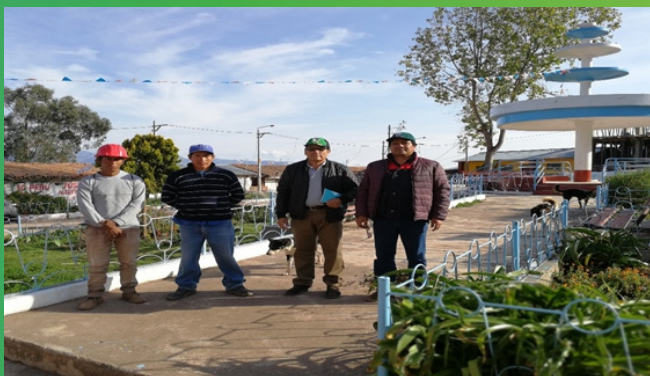
Informantes calificados Chapimarca-Aymaraes.