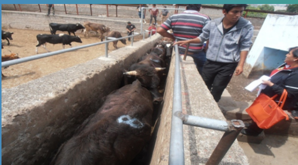
Ganado de vacuno para ser beneficiado.