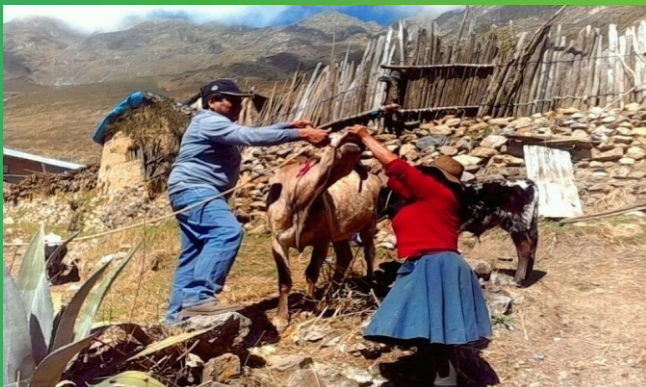
Dosificación de vacunos en Huayrapampa-Abancay.