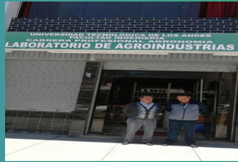
*Aguardiente de caña y derivados.