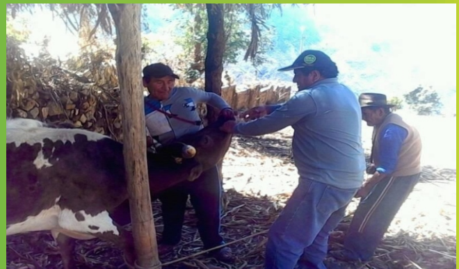
Asistencia técnica en Lambrama-Abancay.