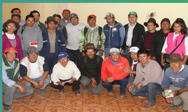
Informantes calificados Sector estadístico Tintay.