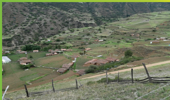
Sector estadístico Colcabamba-Aymaraes.