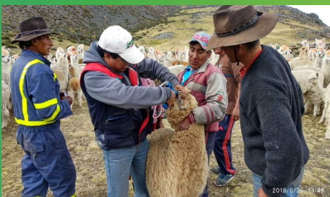
Alpacas atendidas en Virundo-Graú.