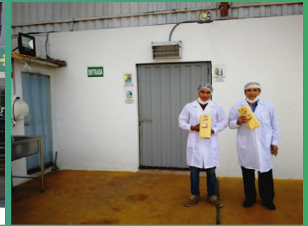
*Producción de Tallarines.