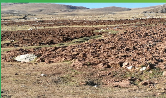
Sector estadístico Mollocco-Antabamba.