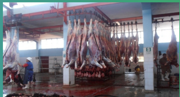
Carcasas de ganado vacuno.