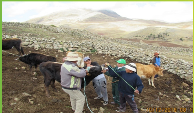
Atención de vacunos en Challhuahuacho-Cotabambas.