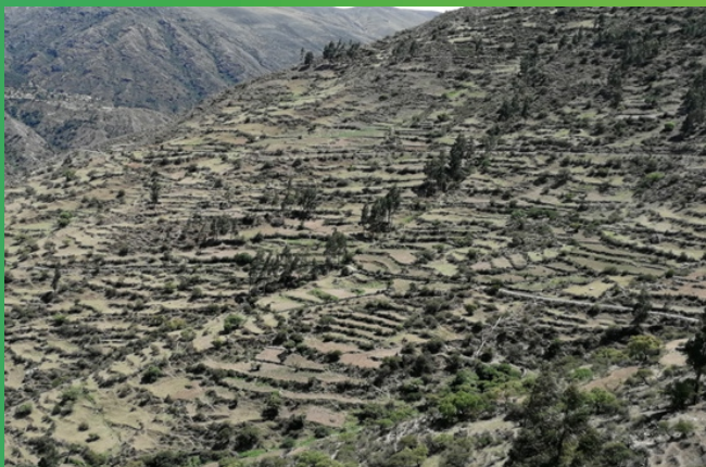
Sector estadístico Huanzo-Antabamba.