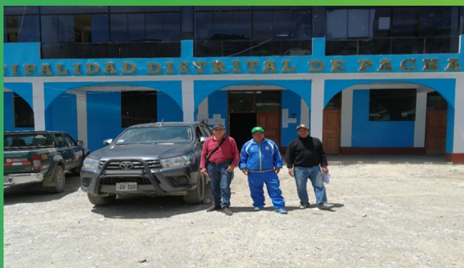
Informantes calificados Pachaconas-Antabamba.