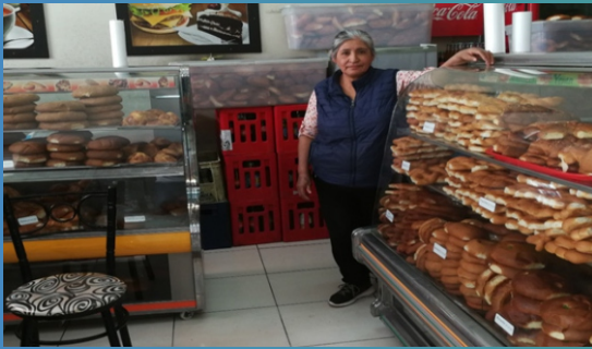
*Panadería y Pastelería Pikis Pan.

Fuente: Dirección de Estadística Agraria e Informática (DEAI)