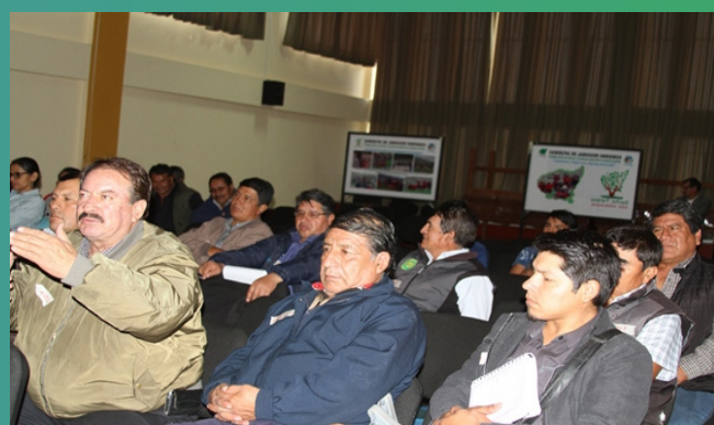
Profesionales y Técnicos de la DRA/AP.