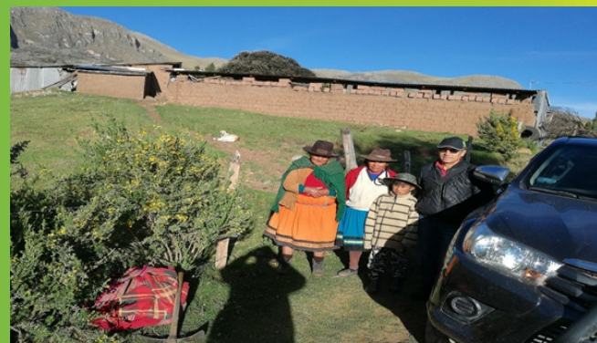
Informantes calificados Mollocco-Antabamba.