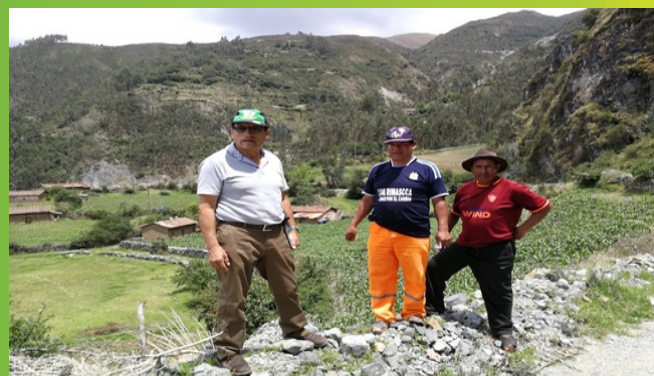
Informantes calificados San Mateo-Aymaraes.