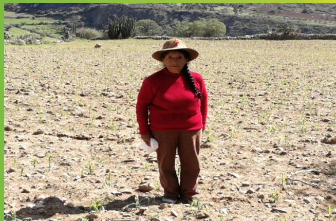
Sector estadístico Capaya-Aymaraes.