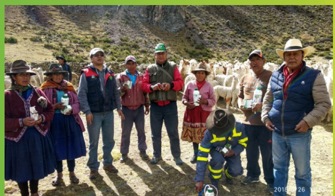
Asistencia técnica por Agencia Agraria Graú.