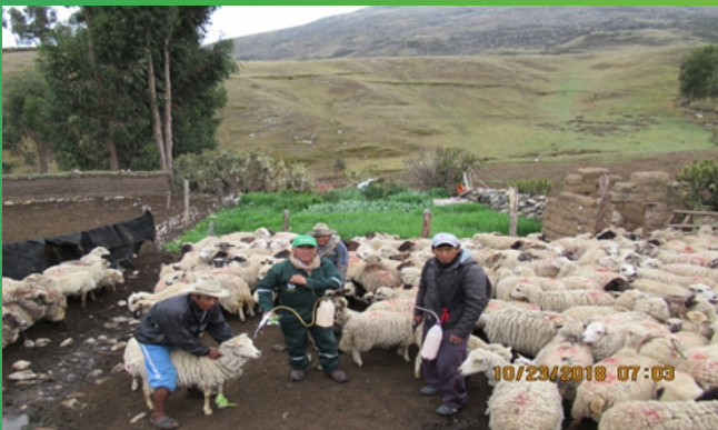
Aplicación de antiparasitarios en Mara-Cotabambas.