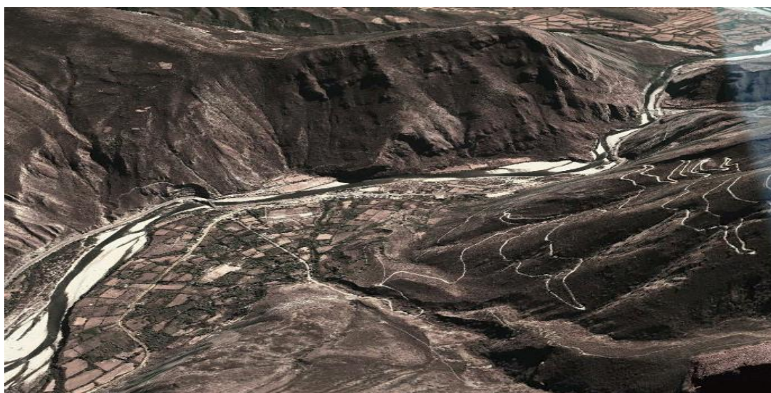
Cuadro N° 02 Caminos peatonales que une Santa Rosa-Santiago