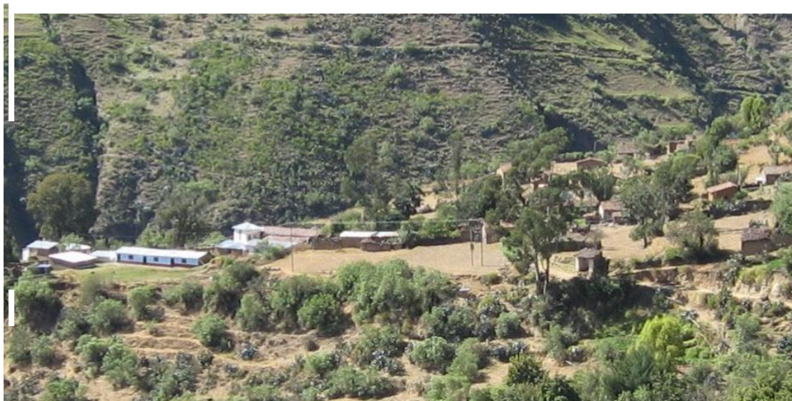
Imagen Nº 02 La Institución Educativa de la Santiago