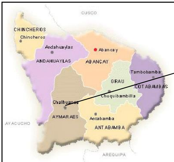
Gráfico N°2: MAPA DE UBICACIÓN DE LA PROVINCIA DE AYMARAES.