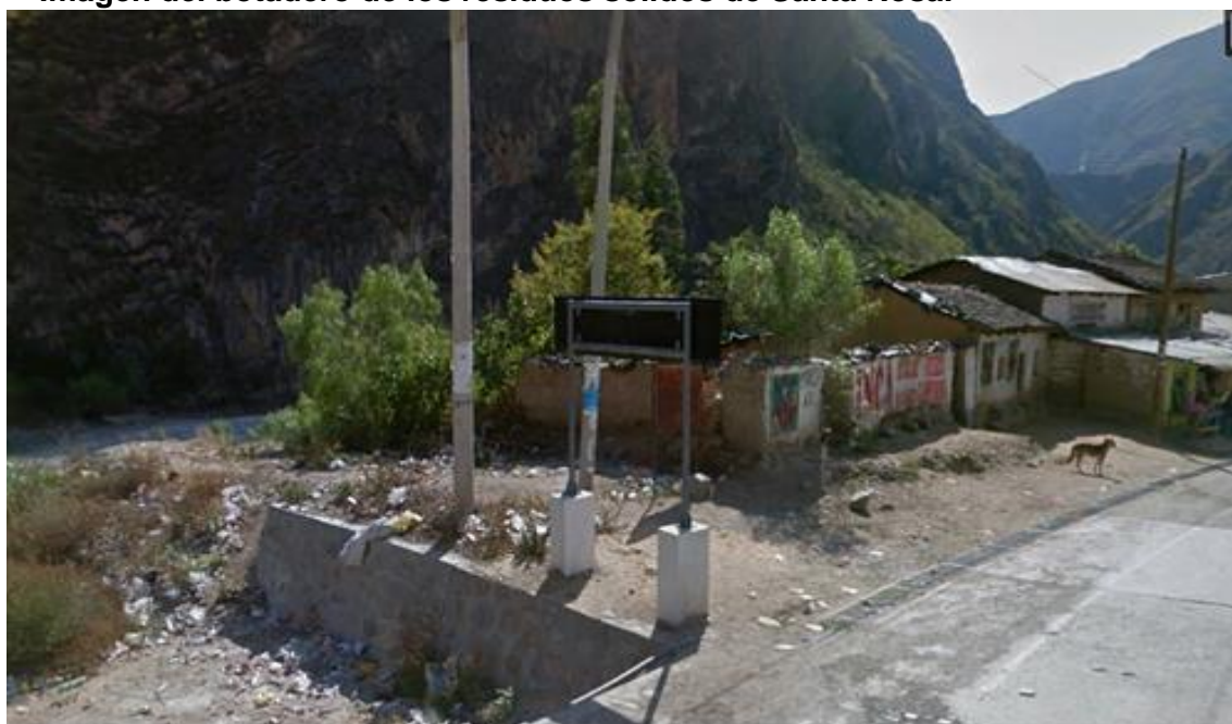
Imagen del botadero de los residuos sólidos de Santa Rosa.

Comunidad Campesina de Santiago Santa Rosa fue reconocida con R.S S/N el 21 de abril de 1949.