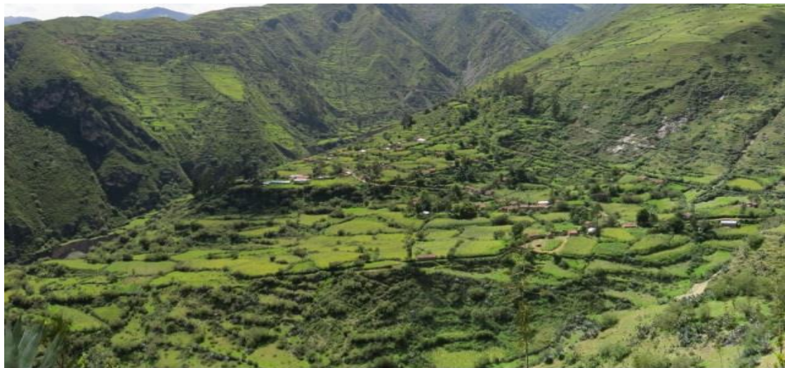
Los terrenos agrícolas de la comunidad Santiago Santa Rosa