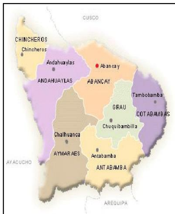
Figura N°2: Región y Provincia