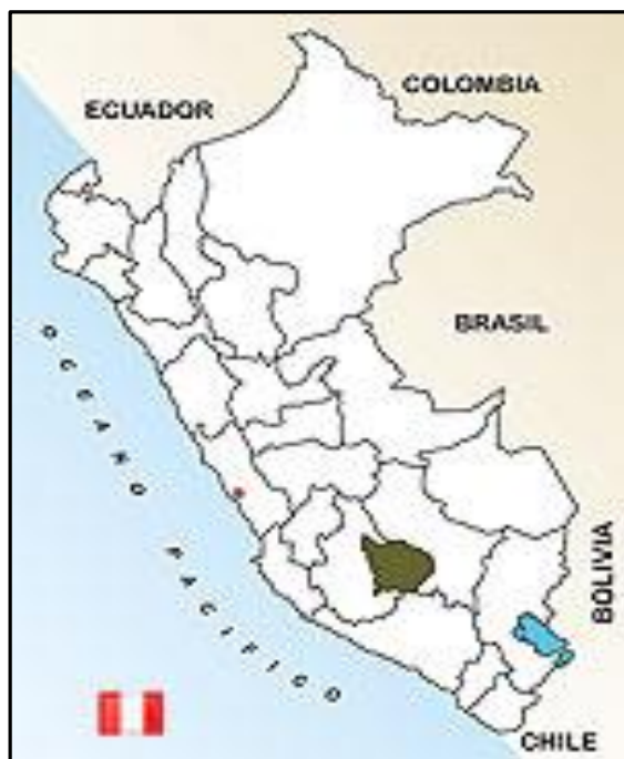
Figura N° 01: Región Apurímac