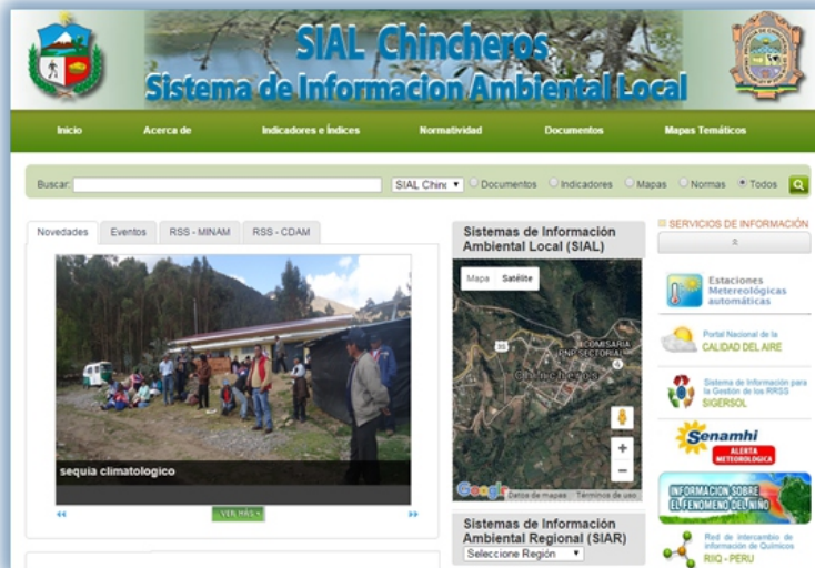
Sistema de Información Ambiental Local - SIAL Chincheros en Funcionamiento.