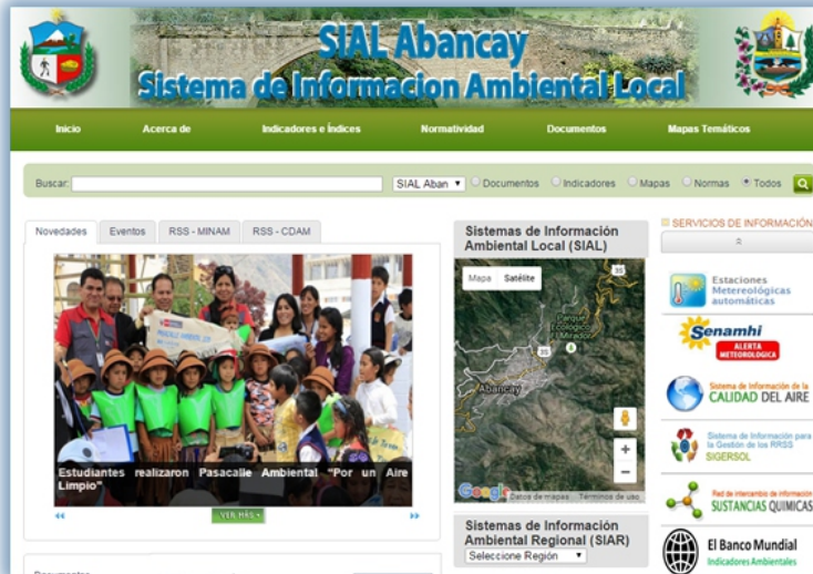
Sistema de Información Ambiental Local - SIAL Abancay en Funcionamiento.