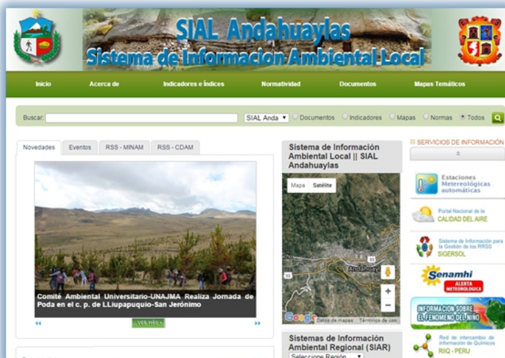
Sistema de Información Ambiental Local - SIAL Andahuaylas en Funcionamiento.