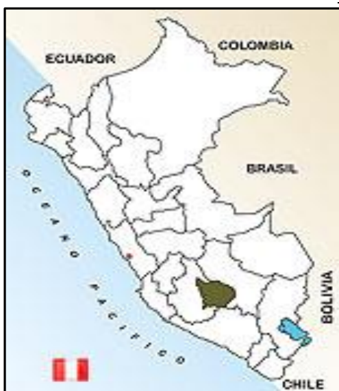
Figura Nº 01: Región Apurímac