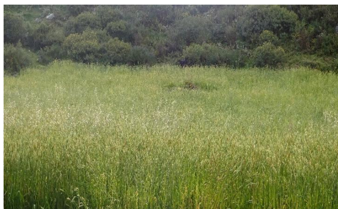
Imagen 04: actividad productiva de la comunidad de Yadquire

La base productiva de la comunidad es la actividad agropecuaria representando el 90 % de la PEA; existe un bajo nivel de producción y productividad, reluciendo un bajo nivel de ingresos y baja calidad de vida