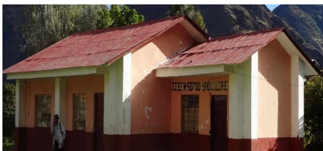
Imagen 01: II.EE. primaria Yadquire

En la Comunidad Campesina de Yadquire, se brinda los servicios de educación en los niveles de inicial y primaria.