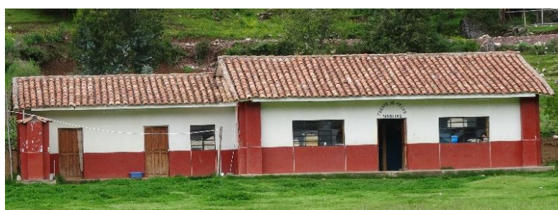
Imagen 02: infraestructura del puesto de salud de Yadquiri

La comunidad campesina de Yadquire cuenta con un puesto de salud instalada en la misma comunidad, donde se atiende a la comunidad de Yadquire, Sijawi y Ayumaqui,