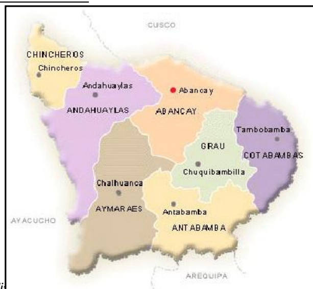
Figura Nº2: Región y Provincia