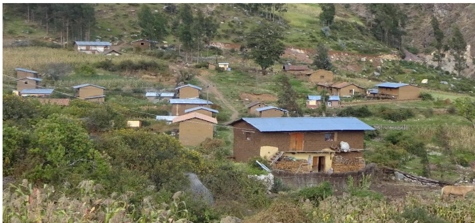
Imagen 03: vista panorámica de la comunidad de Yadquire

En la comunidad campesina de Yadquire según el diagnóstico realizado las viviendas son construcciones de adobe con techos de diferentes materiales como calaminas, paja y teja. No cuentan con saneamiento básico solo con silos secos.