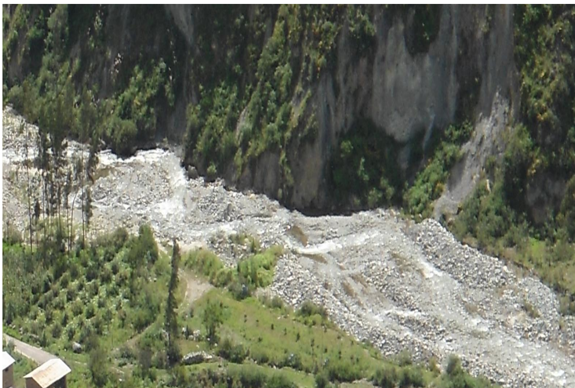
Fotografía: Vista panorámica de los recursos naturales

La comunidad que cuenta con el recurso agua, sin embargo aún no gestiona adecuadamente dicho recurso, pues tiene una riqueza en recursos naturales aún por aprovechar para el desarrollo de la propia comunidad.