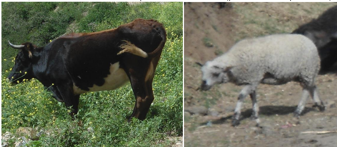
CUADRO N°09 – Población animal por familia

Es la 2º actividad de importancia y es un componente clave de la economía familiar, dado que de la venta de ganado (principal capital de las familias) se genera el ingreso para los gastos básicos de la familia. Además, constituye una fuente proteica por el consumo de leche, carne y sus derivados. La población pecuaria está dada por el ganado vacuno, ovino, porcino, caprino, cuyes y otros. El ganado vacuno es una de las especies más importantes alcanzando un promedio de 02 cabezas de ganado por familia, esta crianza se caracteriza por ser aún extensiva (pastoreo a campo abierto).