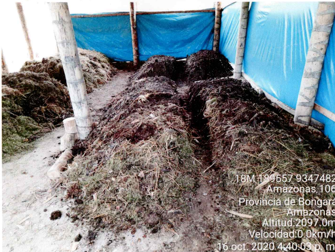
Imagen 1: Totalidad (07) de las Pilas en la Planta de Valorización de Residuos Sólidos Orgánicos