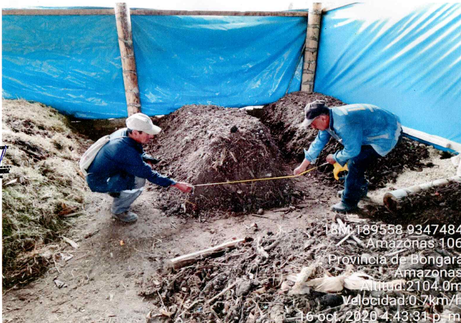
Imagen 3: Obteniendo las medidas del Ancho de Pila de Compostaje

JEFE DE LA DIVISIÓN DE SUPERVISIÓN Y ASISTENCIA TÉCNICA ALOS MUNICIPIOS DEL SISTEMA NACIONAL DE MANEJO INTEGRAL DEL RESIDUO SÓLIDO DNI N° 44703910