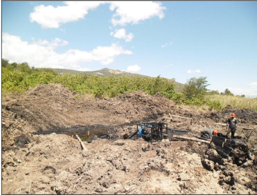
Personal de Mantenimiento de la empresa PETROPERU En labores de recuperación del petróleo derramado