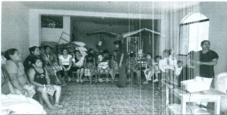
Desarrollo de sesión educativa en el A.A.H.H. Señor de los Milagros con participación del personal de la Sub Gerencia de Salud y Programas Alimentarios.