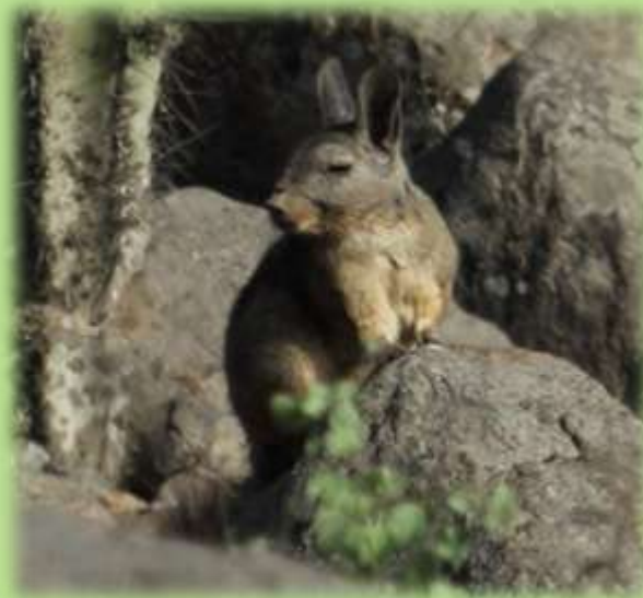
“Vizcacha” Lagidium peruanum