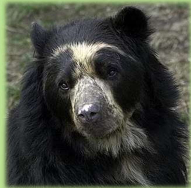
“Oso de anteojos” Tremarctos ornatus