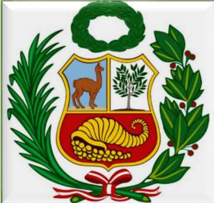
Constitución Política de Perú, 1993

Art. 66° Los recursos naturales renovables y no renovables, son patrimonio de la nación.