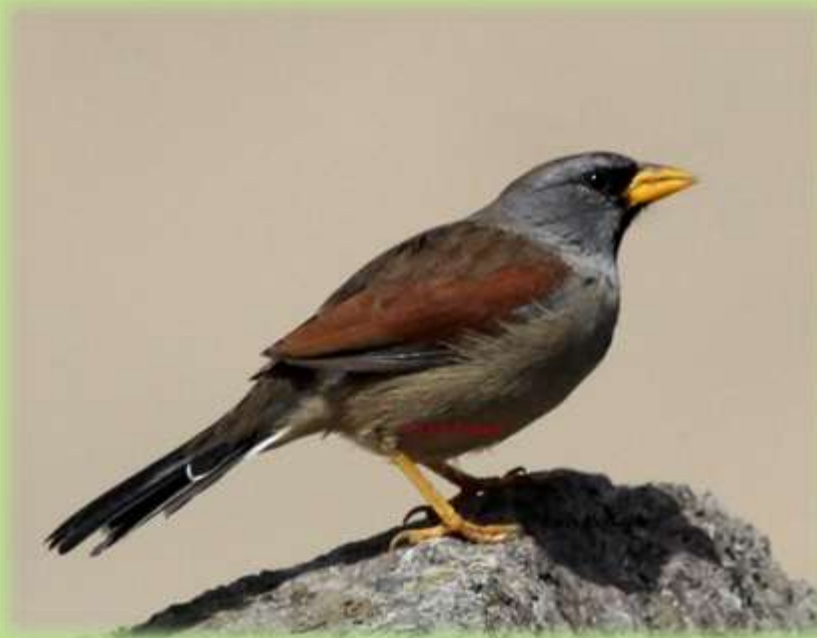
“Fringilo inca grande” Incaspiza pulchra. ENDÉMICO