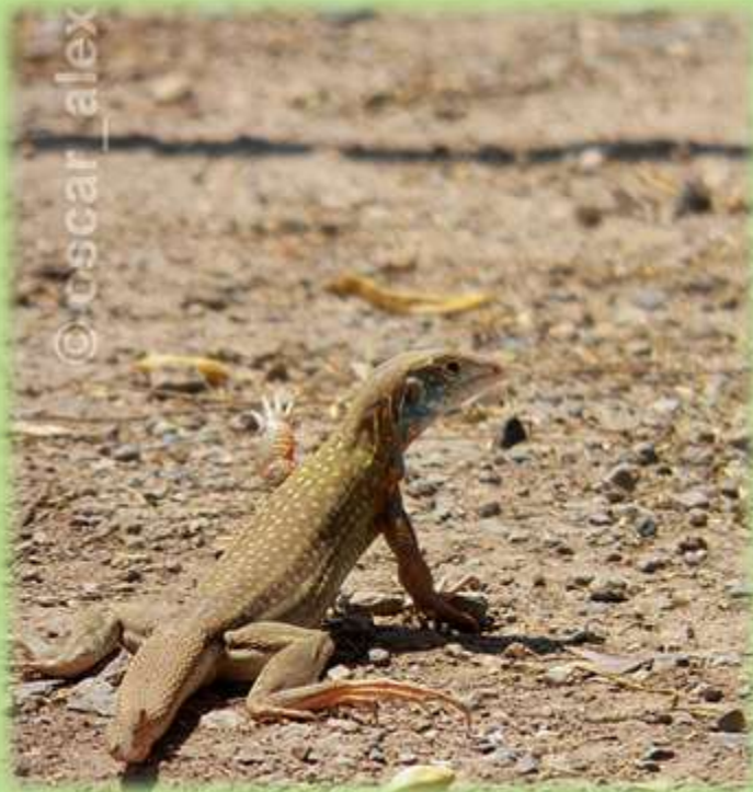
“Cañán” Dicrodon guttulatum