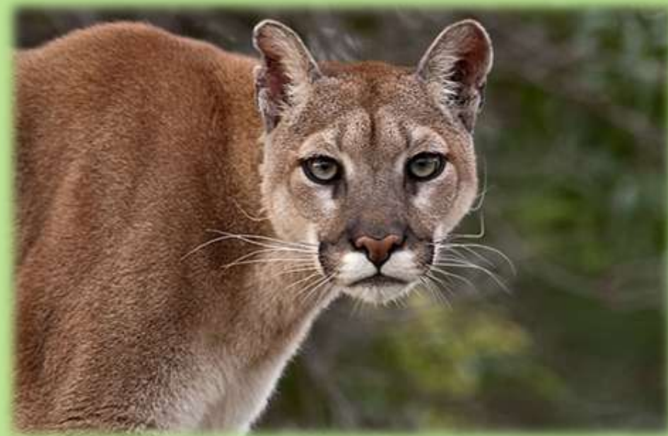
“Puma” Puma concolor