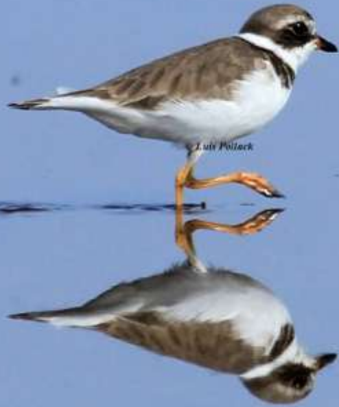
“Chorlo semipalmado” Chardrius semipalmatus