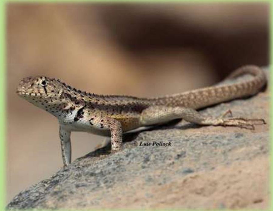
“Lagartija” Microlophus koepckeorum ENDEMICO