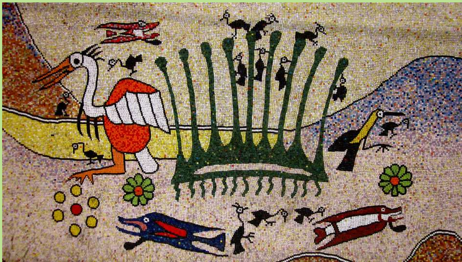
Pictografía Mochica de un totoral. Mural UNT