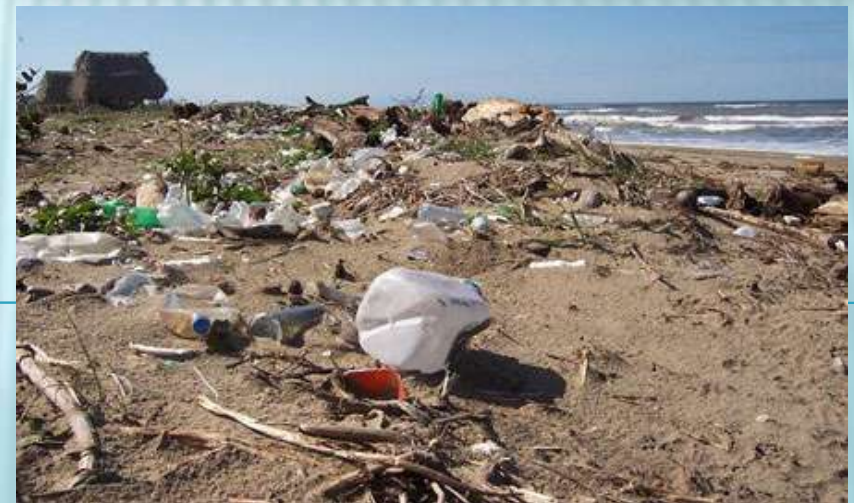
Contaminación de agua