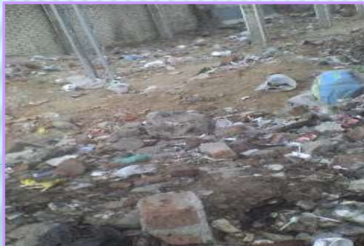
Contaminación del aire (metano, CO 2 )