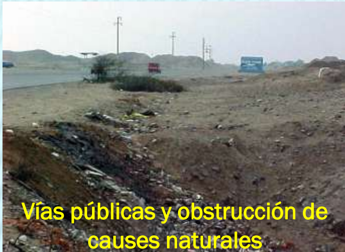
Vías públicas y obstrucción de causes naturales