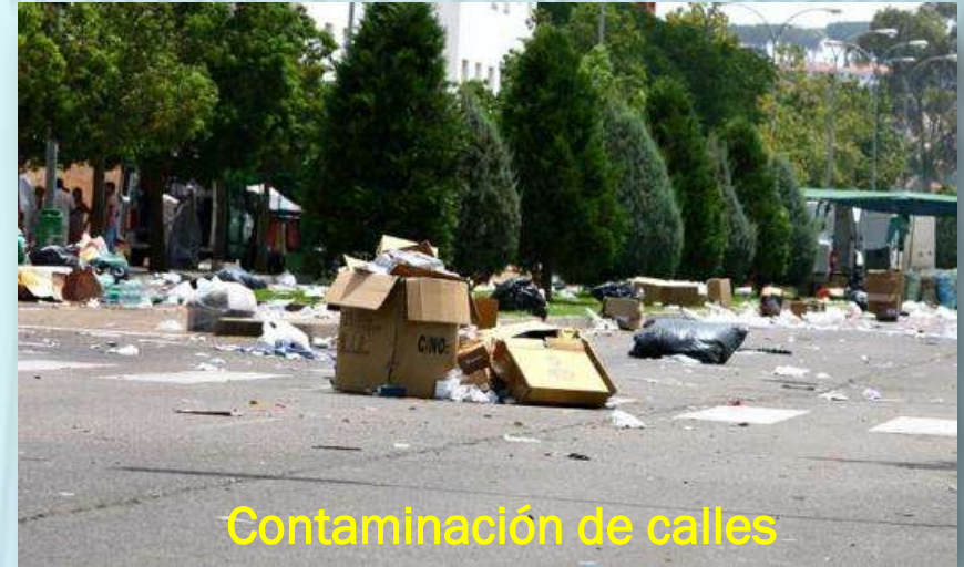
Contaminación de calles