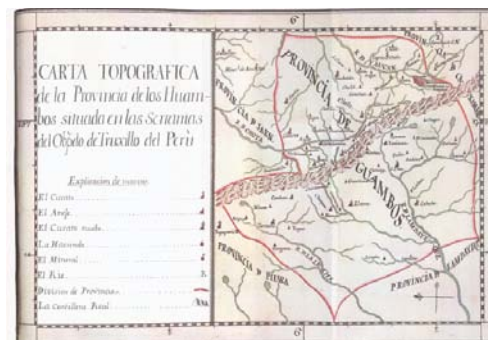
Carta Topográfica 1783

Asimismo, con la dación del Decreto Legislativo N° 1013, Ley de Creación, organización y funciones del Ministerio del Ambiente, tiene como una de sus funciones específicas “ Establecer la política, los criterios, las herramientas y los procedimientos de carácter general para el Ordenamiento Territorial Nacional, en coordinación con las entidades correspondientes ” literal c) del Artículo 7.