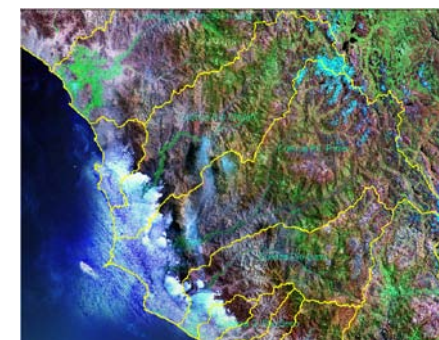
Imagen Satélite 2005