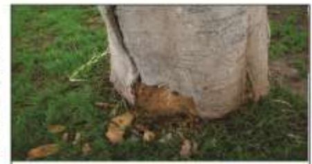
Se puede apreciar que el tallo tiene la corteza dañada (podrida), y

posteriormente en las diferentes urbanizaciones de Trujillo donde hay árboles de 30, 40 y 50 años de antigüedad. Cabe mencionar que en la provincia existen 140 hectáreas de áreas verdes y 390 parques.