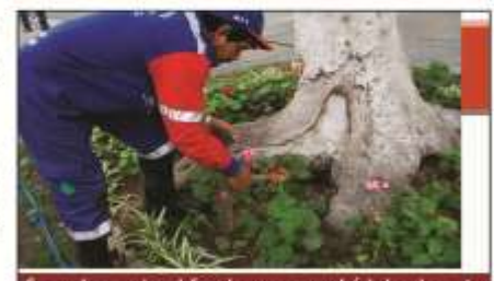
Se puede apreciar el forado, que causa el árbol en la zona.