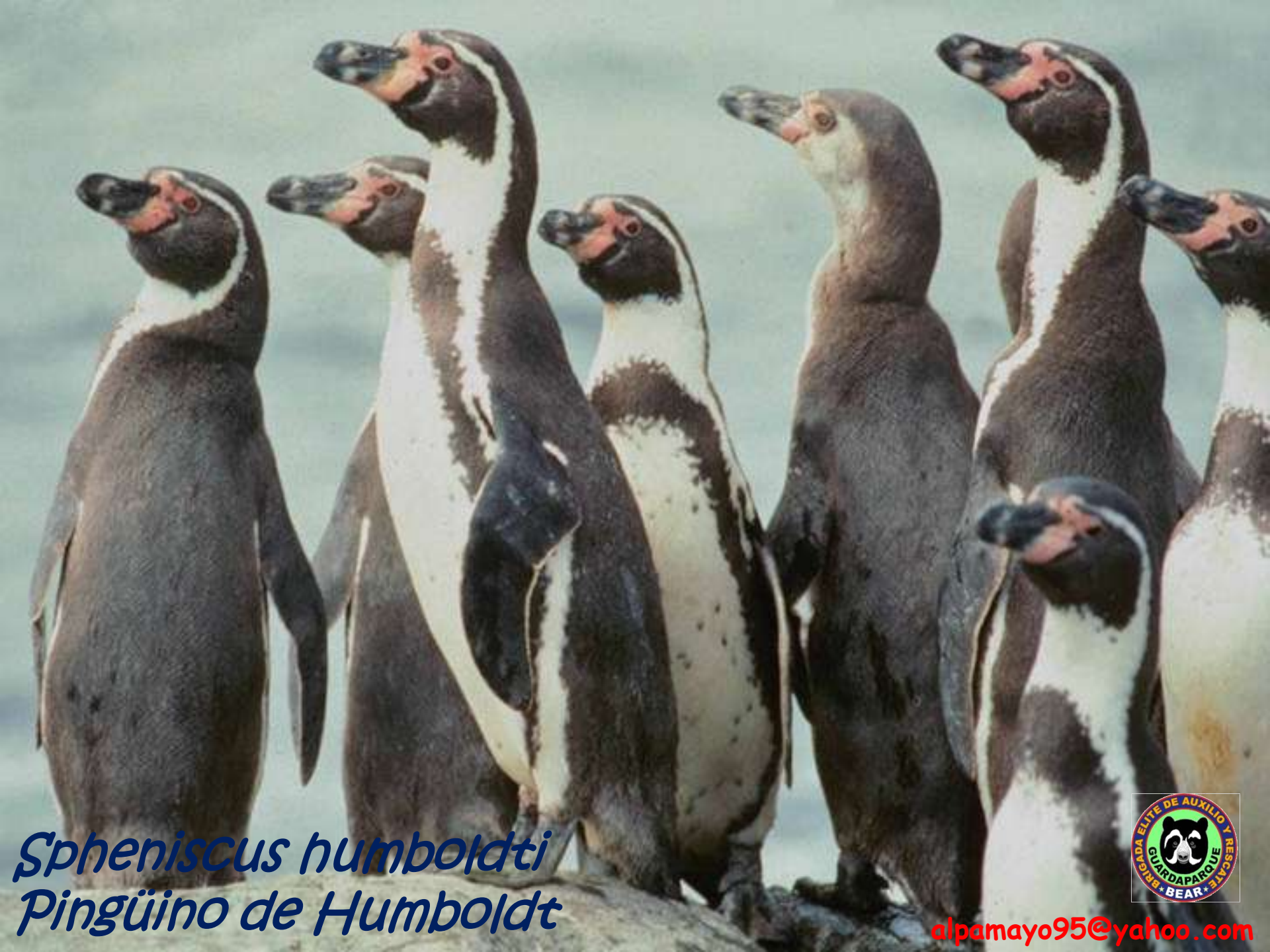
Spheniscus humboldti Pingüino de Humboldt