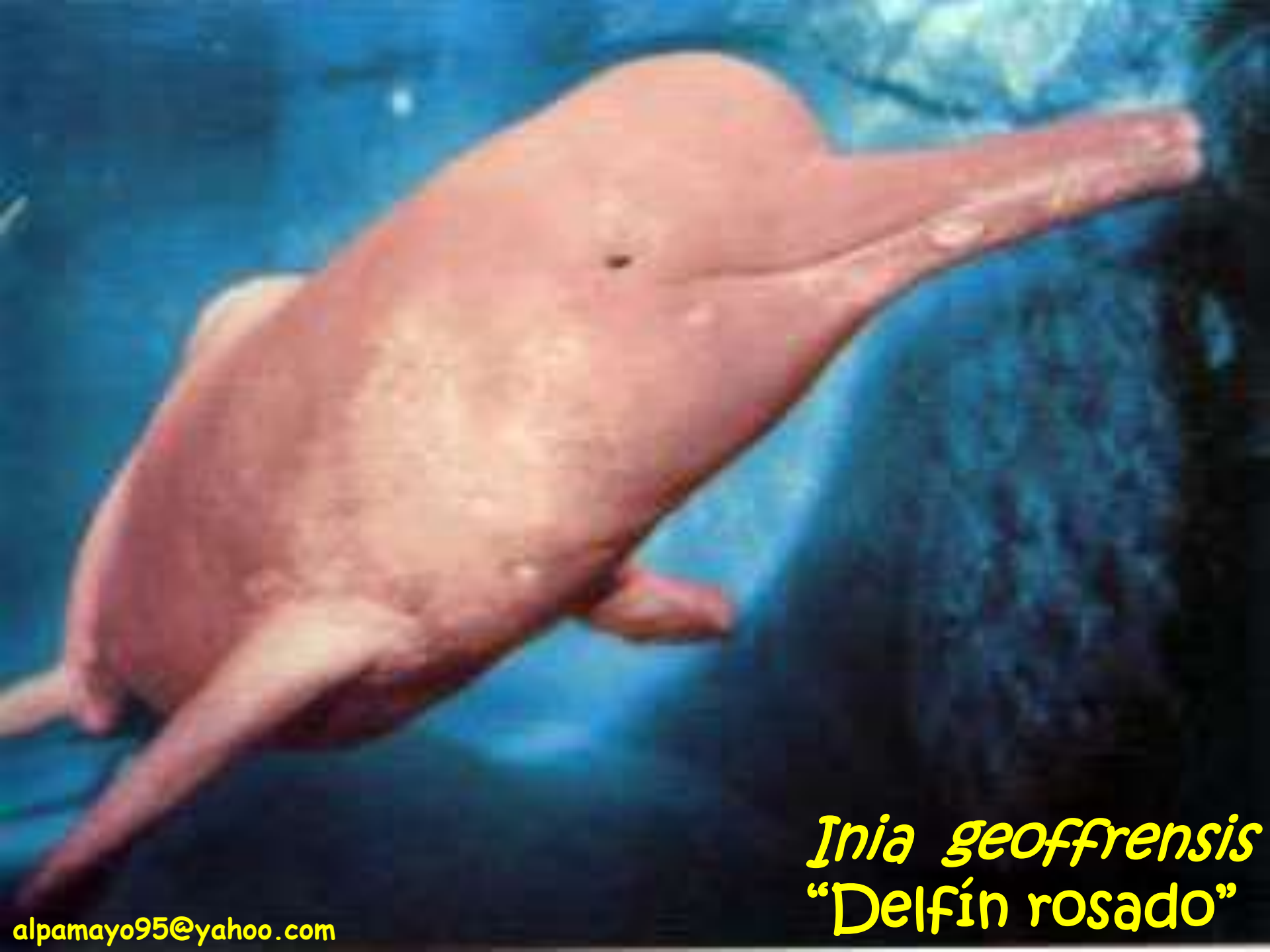
Inia geoffrensis "Delfín rosado"