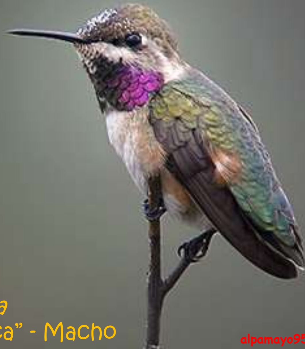
Mirmya micrura “Estrellita Chica” - Macho