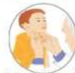
Dolor e hinchazón de los ganglios (bubones o secas)

LOS BUBONES O SECAS pueden aparecer en el cuello, axilas e ingles