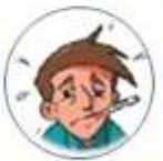
Fiebre > a 38°C