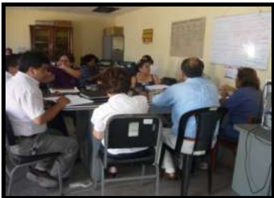
Reuniones de la Comisión de Sensibilización y Capacitación, que cuenta con Plan de Capacitación elaborado