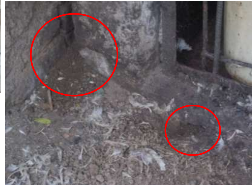
ACOPIO INSALUBRE DE AVES

INFRINGIENDO REGLAMENTO SANITARIO DE FUNCIONAMIENTO DE MERCADOS DE ABASTOS Y LEY GENERAL DE RESIDUOS SOLIDOS