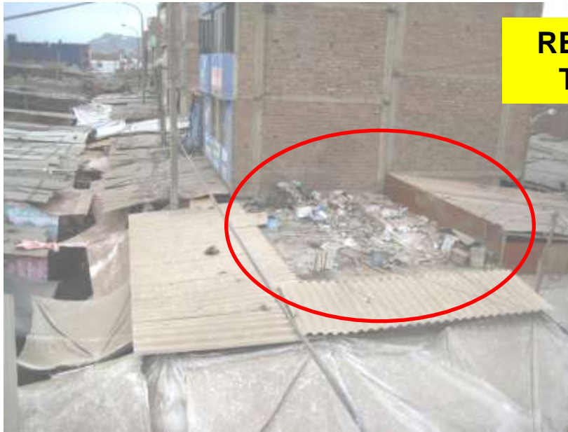
RESIDUOS SOLIDOS EN LOS TECHO DE LOS PUESTOS