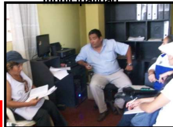
Reunión con Asesor legal del Complejo Autogestionario de Trujillo.

NO TODOS LOS COMITES ESTUVIERON OPERATIVOS