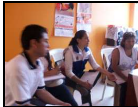
Reunión con presidente del Mercado El Progreso parcela 10721 y personal de la municipalidad