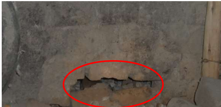
INFRAESTRUCTURA INADECUADA DE LOS PUESTOS QUE CONDICIONAN LA PRESENCIA DE MADRIGUERAS DE ROEDORES