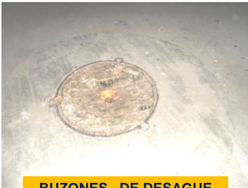
BUZONES DE DESAGUE DESTAPADOS