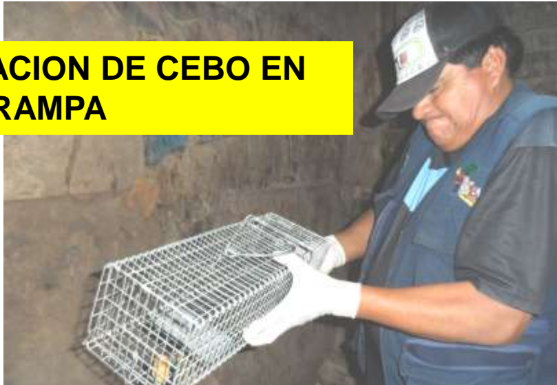
COLOCACION DE CEBO EN CADA TRAMPA