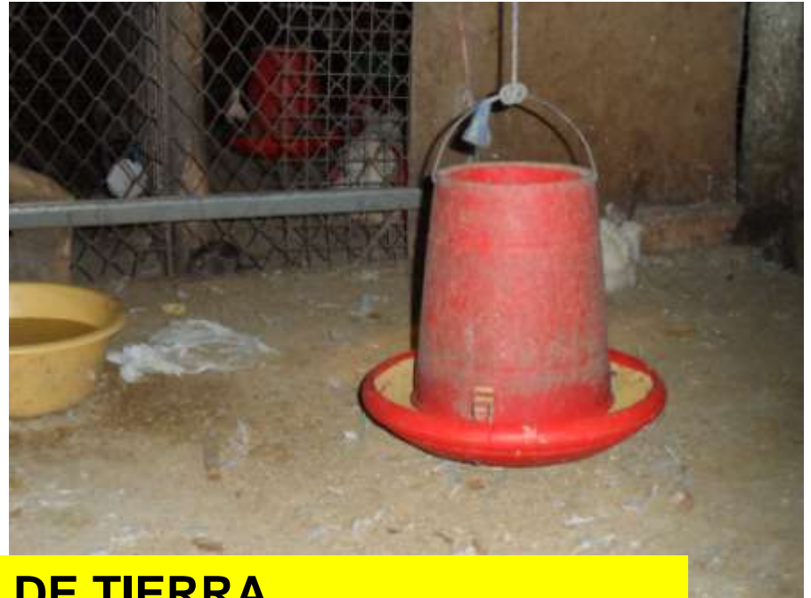
PISOS DE TIERRA

INFRINGIENDO REGLAMENTO SANITARIO DE FUNCIONAMIENTO DE MERCADOS DE ABASTOS Y DECRETO SUPREMO 0798 – VIGILANCIA Y CONTROL SANITARIO DE ALIMENTOS Y BEBIDAS