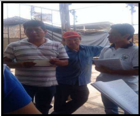
Reunión con presidente del Mercado Mayorista de Frutas.

NO TODOS LOS COMITES ESTUVIERON OPERATIVOS