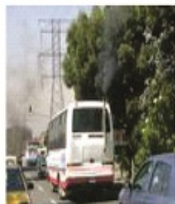
Centro Histórico de Trujillo

Vehículos con motor de combustión e industrias (CO 2 , CO, óxido de nitrógeno, plomo, partículas sólidas)