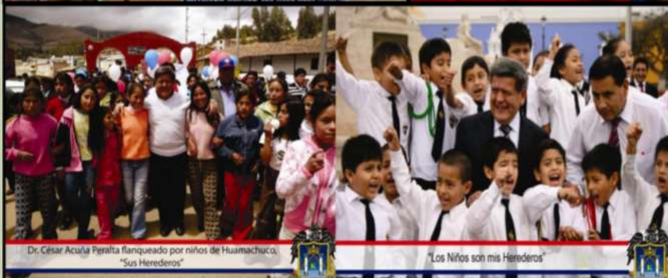
Dr. César Acuña Peralta flanqueado por niños de Huamachuco. "Sus Herederos"