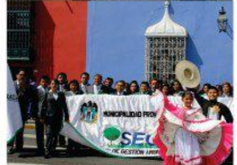
Trabajadores del SEGAT participan en desfile por marco de celebración del Día Del Trabajador Municipal realizado en la plaza Mayor de Trujillo.