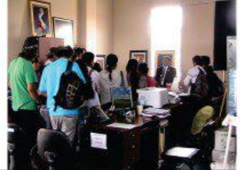
Grte. General C. Azabache promueve proyecto "Engrandecimiento de Jóvenes" para fomentar la micro empresa a hijos de trabajadores.