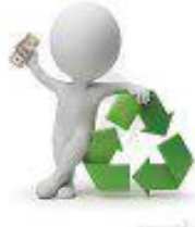
Tratamiento y Disposición Final