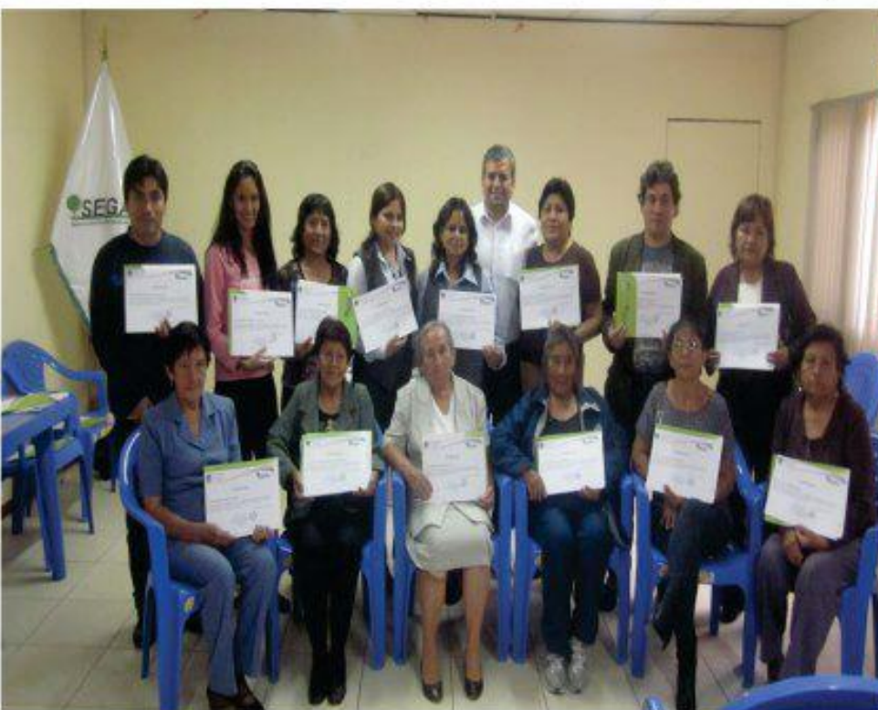
ENTREGA DE CERTIFICADOS A LOS PARTICIPANTES