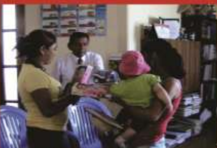
Jovenes madres en busca de empleo