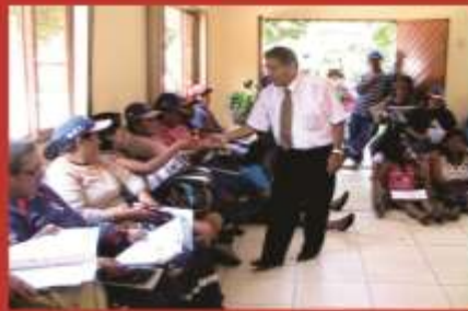
Personal de Limpieza Publica