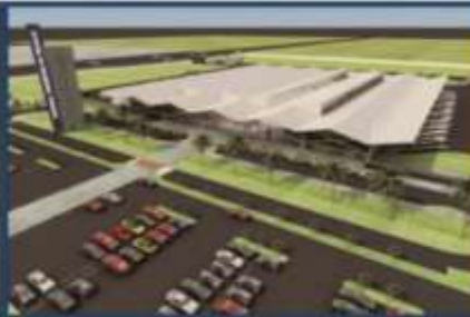
Terminal Terrestre TTT