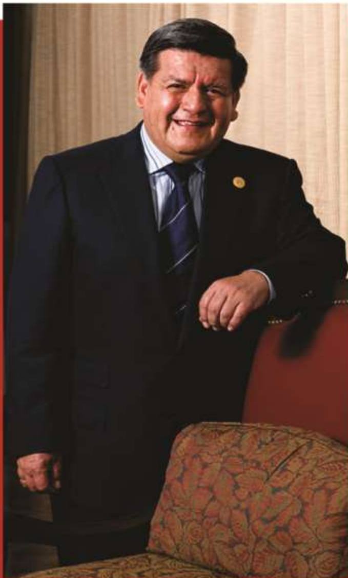
CÉSAR ACUÑA PERALTA ALCALDE

Por eso en esta fecha mi reconocimiento al esfuerzo de los trabajadores y funcionarios públicos del SEGAT, por contribuir a mejorar la calidad de vida de los trujillanos y a hacer realidad el Gran Cambio de Trujillo.