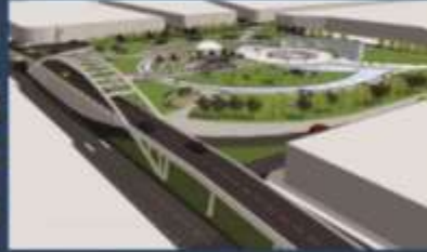
By pass Óvalo Mansiche