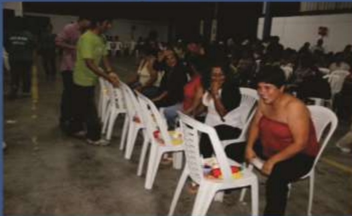
TRABAJADORES PARTICIPANDO EN CONCURSO DE GLOTONES

Posteriormente, continuó la actividad programada alusiva a los hombres y mujeres que con su trabajo diario construyen el desarrollo del País, el titular atendió personalmente a sus colaboradores; repartiendo un delicioso potaje preparado especialmente para la ocasión.