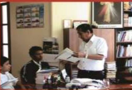
Reunión con estudiantes