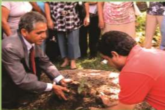
Al acto concurrió un nutrido público que acompañó a la plantación