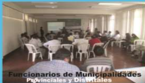
Funcionarios de Municipalidades Provinciales y Distritales

El objetivo del Taller tuvo como fin el fortalecimiento de capacidades institucionales de los responsables de los órganos con competencia de Supervisión, Evaluación y Fiscalización Ambiental, quienes serán los encargados de formular, ejecutar y evaluar el PLANEFA, para el desarrollo de sus actividades en el ámbito de su competencia