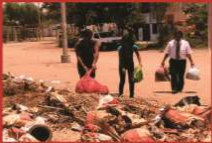
Participa en campaña de Limpieza