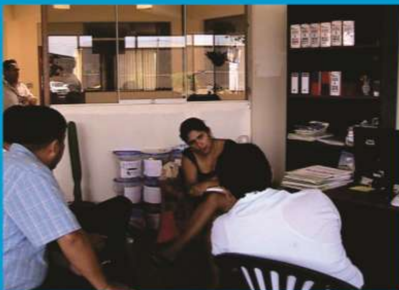
REUNIÓN CON FUNCIONARIOS DEL SEGAT

Dicho programa se viene implementando en cumplimiento a la Ley General de Residuos Sólidos Ley N° 27314, en su Art. 14° indica que dentro de las operaciones y procesos del sistema de manejo de residuos sólidos tiene la minimización de residuos, la segregación en la fuente y reaprovechamiento, y su Modificación del Decreto legislativo N° 1065, en su Art. 10, numeral 12, sobre el rol de las Municipalidades, el de implementar programas de segregación en la fuente y la recolección selectiva de los RR.SS. en su jurisdicción, facilitando su aprovechamiento y asegurando su disposición final adecuada. Así mismo mediante DS N° 004-2012-EF, establece los procedimientos para implementar el programa de incentivos para alcanzar la meta del programa de Modernización Municipal para el año 2012 donde la meta es de 7% de los predios urbanos del distrito sean incorporados al programa. Para dicho propósito la Municipalidad Provincial, el SEGAT y con la participación voluntaria y activa de 4,500 familias aproximadamente viene cumpliendo con éxito el programa, para lo cual el Gerente General del SEGAT invita a todos los vecinos a participar del programa de segregación.