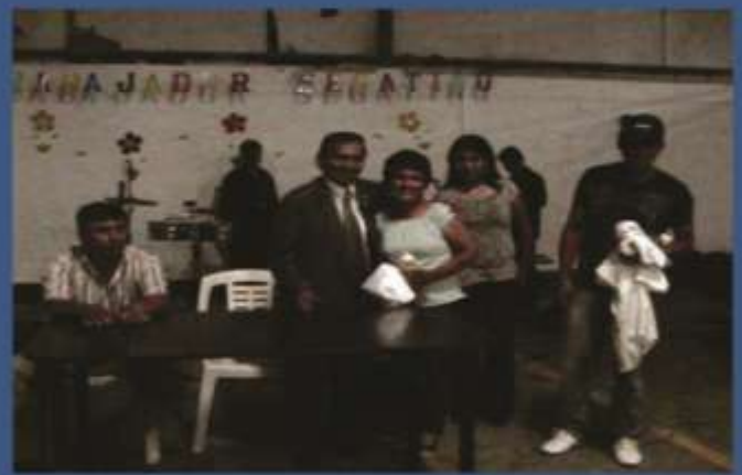
GERENTE ENTREGA PRESENTES A TRABAJADORES