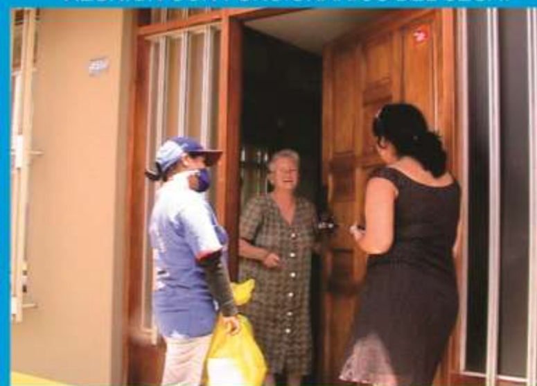
Supervisando reciclaje en la ciudad