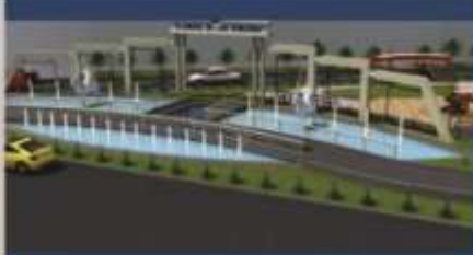
Alameda de los Héroes