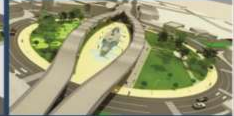
By pass Óvalo Grau