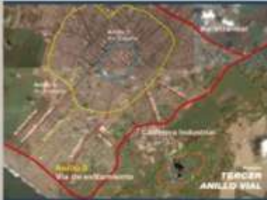
Tercer Anillo Vial de Trujillo