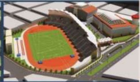
Ciudadela Deportiva Mochica-Chimú