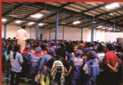
Gerente reunido con personal operativo