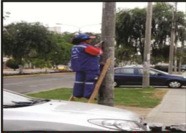
Limpieza de postes y Avenidas Principales