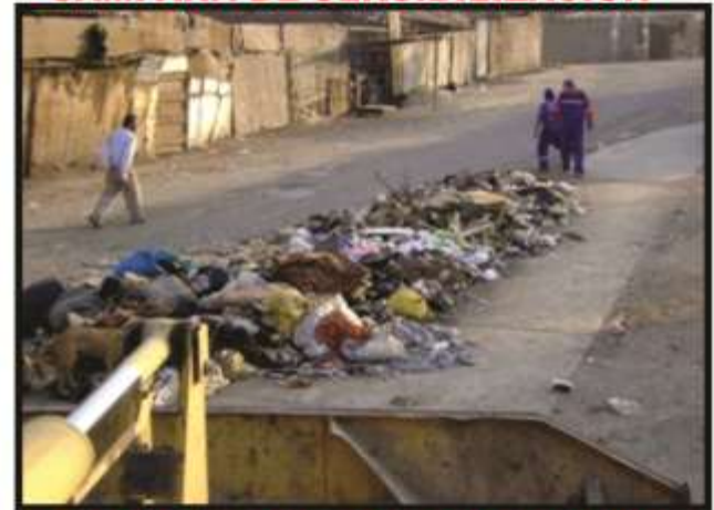
Recojo de inservible en Mercado La Hermelinda