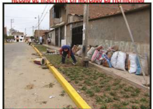
Habilitación de áreas verdes