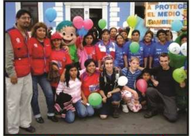
CAMPAÑA DE SENSIBILIZACIÓN