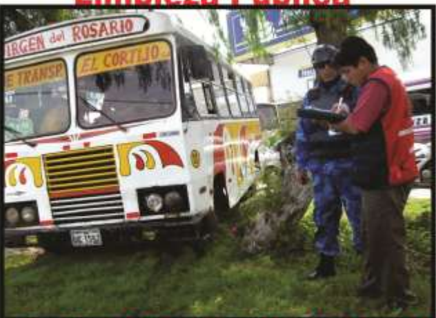
Control y Fiscalización Ambiental