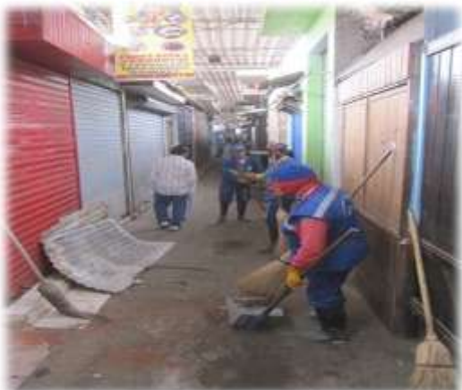
Figura N° 052