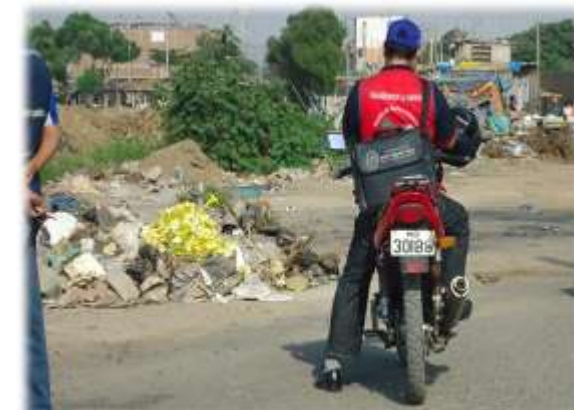
ÁREAS OPERATIVAS UNIDAS EN LA ERRADICACIÓN DE PUNTOS CRÍTICOS (15/04/11)