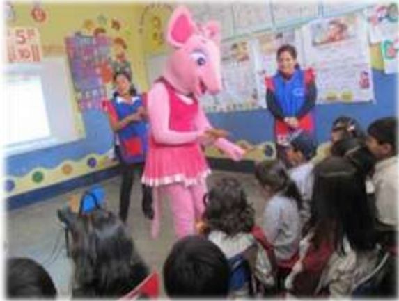
C.E. EVANGÉLICO "MONTE DE SIÓN" (05/09/11)