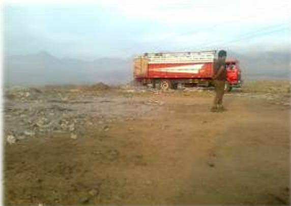
Figura N° 043