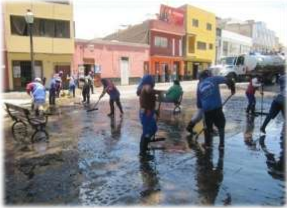
SERVICIO DE BALDEO REALIZADO EN LA PLAZUELA EL RECREO (23/02/11)