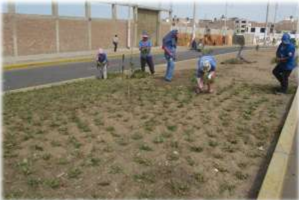
HABILITACIÓN Y SIEMBRA DE NUEVAS ÁREAS VERDES REALIZADA EN LA AV. METROPOLITANA (01/06/11)