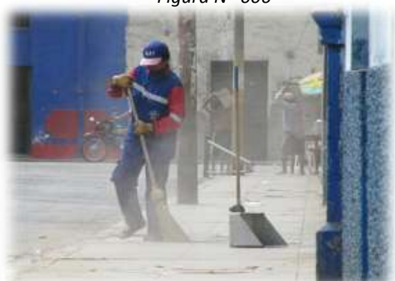
LIMPIEZA Y DESARENADO DE OV. GRAU (22/03/11)