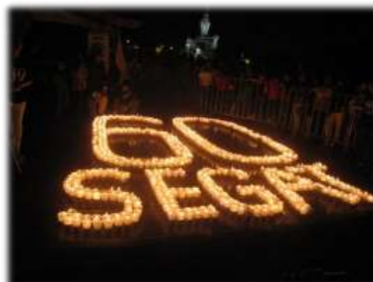
LA HORA DEL PLANETA (23/03/11)