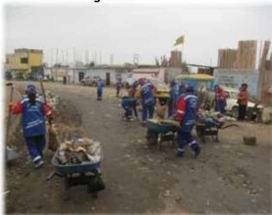
Figura N° 055