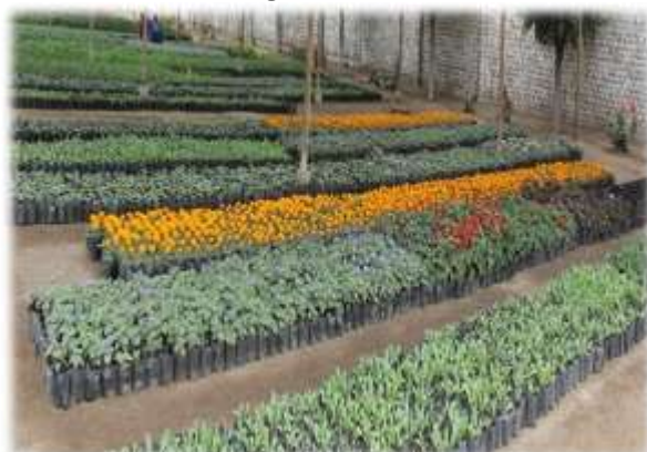
Figura N° 027