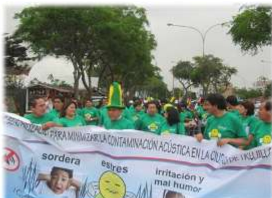
SEMANA AMBIENTALISTA - PASACALLE (08/06/11)