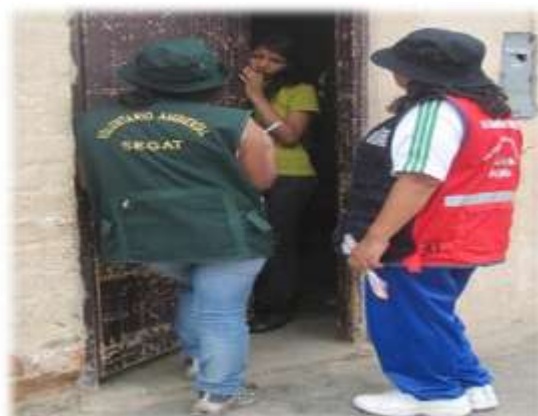
SENSIBILIZACIÓN REALIZADA EN MANUEL ARÉVALO (22/01/11)