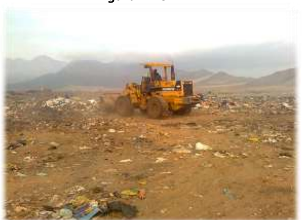
ACUMULACIÓN DE RESIDUOS SÓLIDOS EN PILAS (27/10/11)