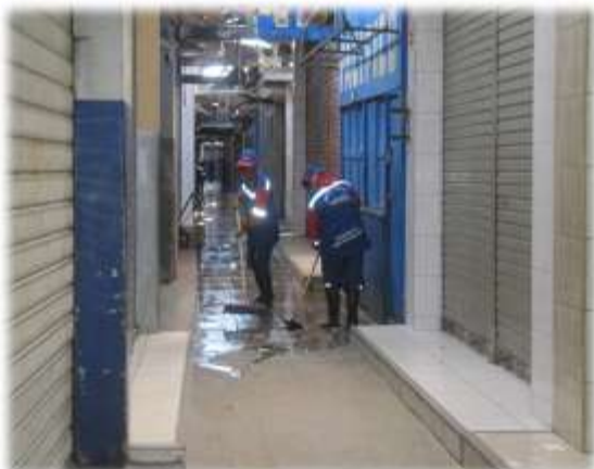
Figura N° 056