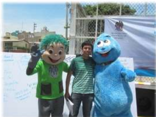
DÍA MUNDIAL DEL AGUA (22/03/11)