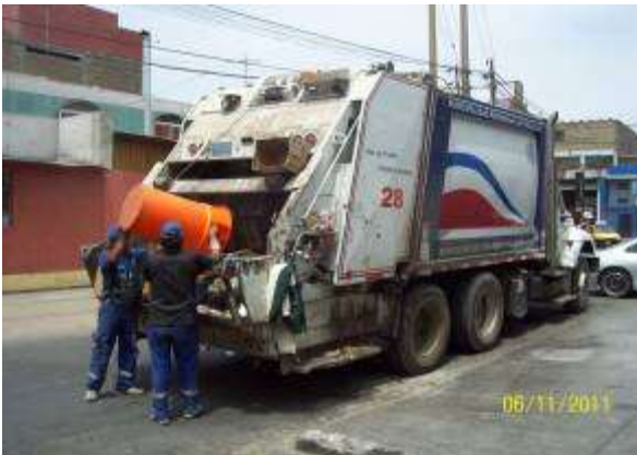
RECOLECCIÓN DE RESIDUOS SÓLIDOS DOMICILIARIOS (06/11/11)