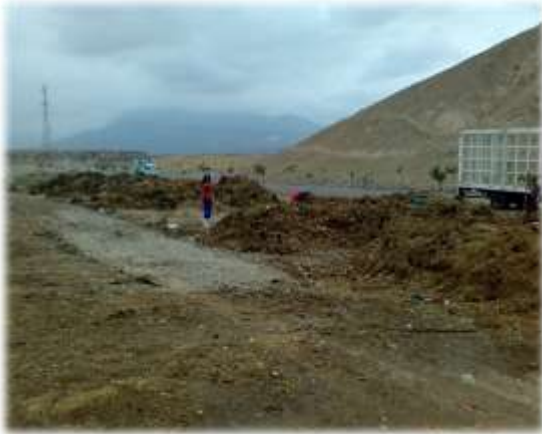
Figura N° 039