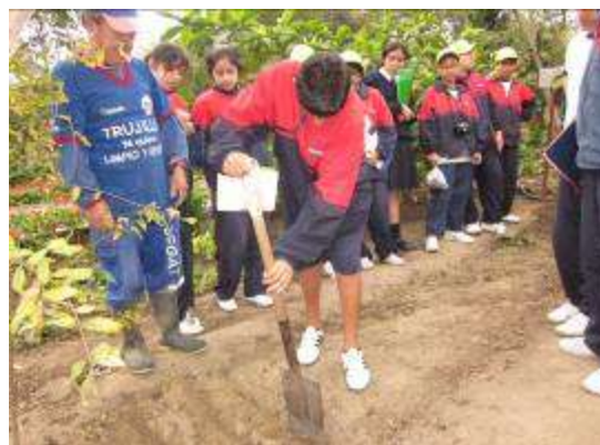
TALLERES DE HORTICULTURA