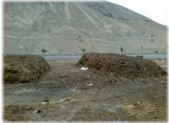
ELABORACIÓN Y PRODUCCIÓN DE COMPOST (29/10/11)