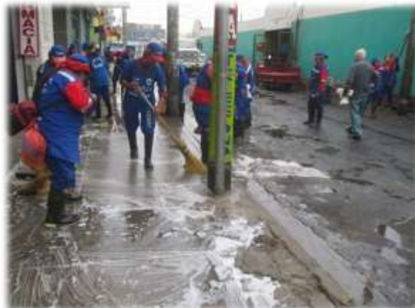
BALDEADO DE EXTERIORES MERCADO LA UNIÓN (14/09/11)