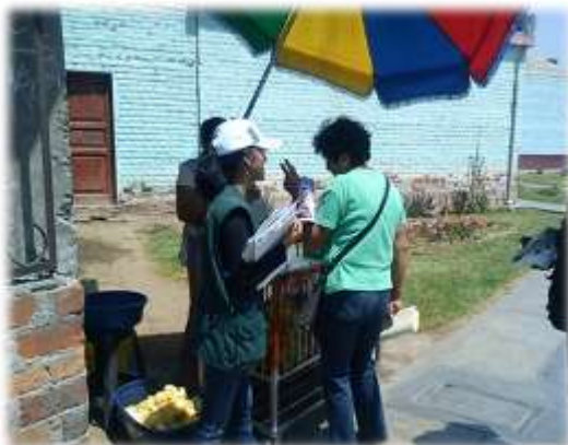
Figura N° 070