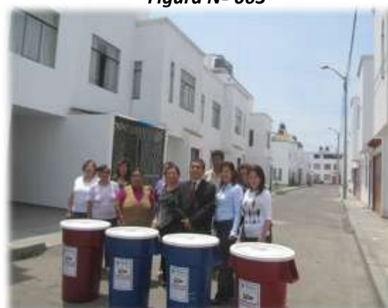
ENTREGA DE TACHOS DE SEGREGACIÓN A LA RESIDENCIAL LOS CEDROS (16/11/11)