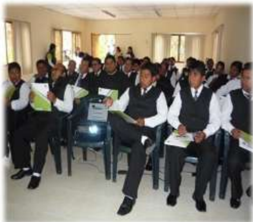
Figura N° 076