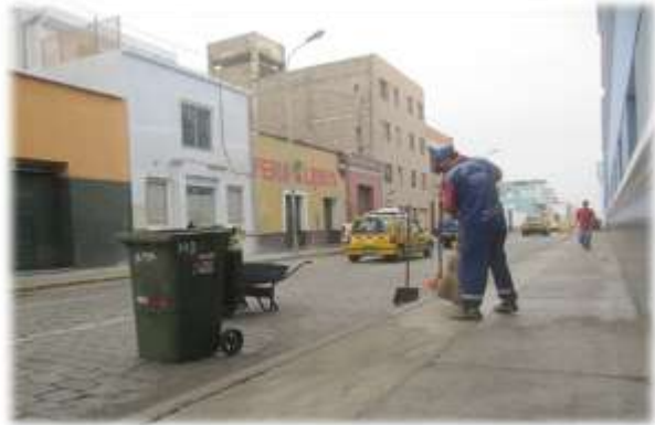
SERVICIO REALIZADO EN EL CENTRO HISTÓRICO (03/06/11)