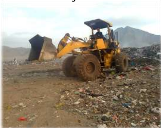
Figura N° 041