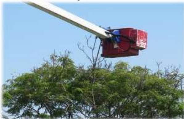
Figura N° 019

PODA DE ÁRBOLES REALIZADA EN EL ÓVALO MANSICHE (22/01/11)