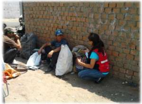
CAPACITACIÓN A RECICLADORES INFORMALES (17/11/11)