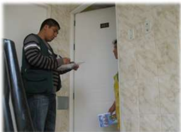
Figura N° 060