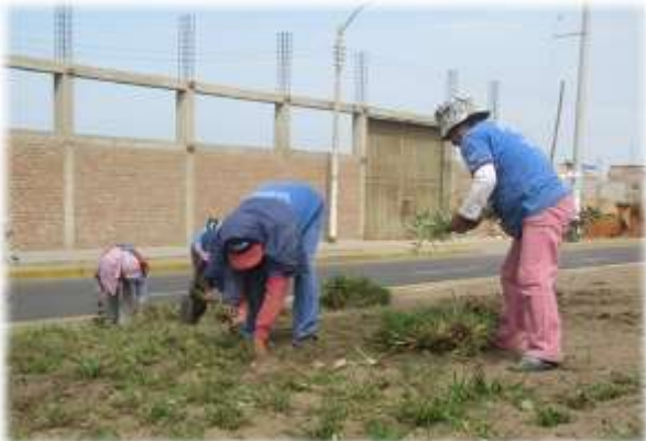
Figura Nº 014