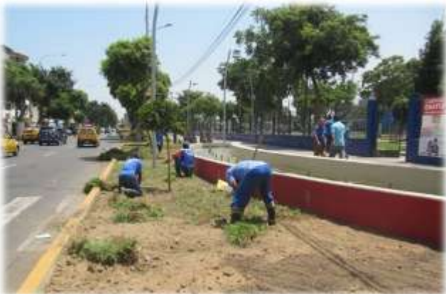
HABILITACIÓN Y SIEMBRA DE NUEVAS ÁREAS VERDES REALIZADA EN LA AV. MANSICHE (04/04/11)