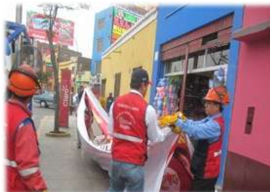
OPERATIVO DE CONTAMINACIÓN VISUAL, RETIRO DE BANNERS (22/07/11)