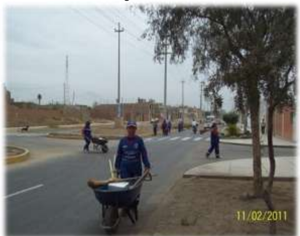
CAMPAÑA EN LAS PRADERAS DEL NORTE, ESPERANCITA, ROSA DE AMÉRICA II ETAPA, Y LOS GIRASOLES DE SAN ISIDRO (11/02/11)