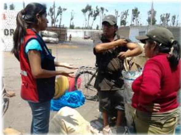
Figura N° 046