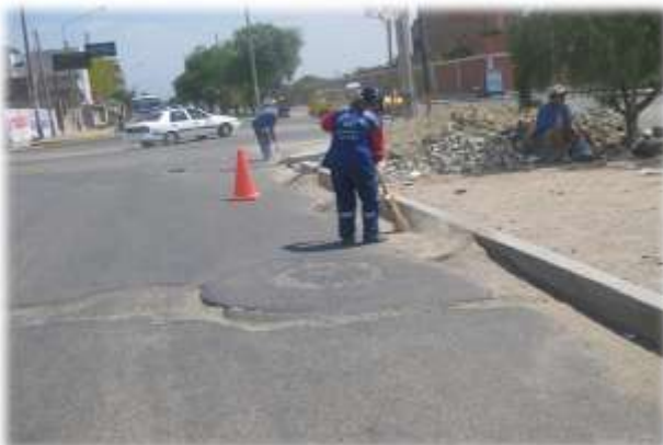
LIMPIEZA Y DESARENADO DE AV. AMÉRICA OESTE (29/04/11)