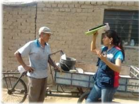
Figura N° 044