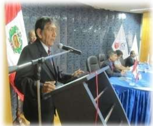
Figura N° 078