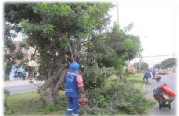
Figura N° 020

PODA DE ÁRBOLES REALIZADA EN LA AV. JUAN PABLO II (26/05/11)