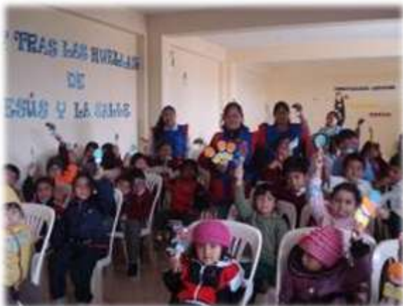
C.E. "SIGNOS DE LA FE DE LA SALLE" (08/09/11)