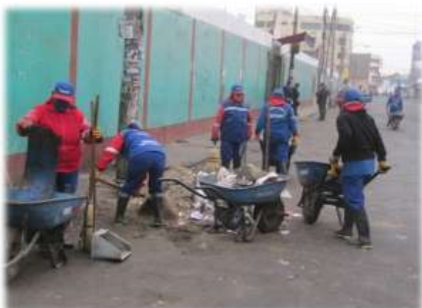
Figura N° 058