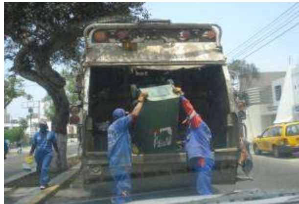
Figura N° 004