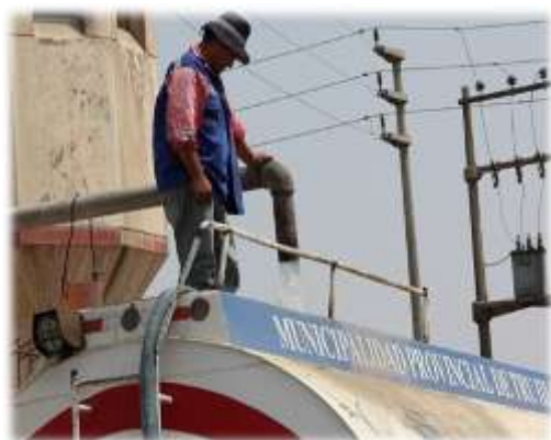
Figura N° 025