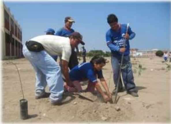
Figura N° 017