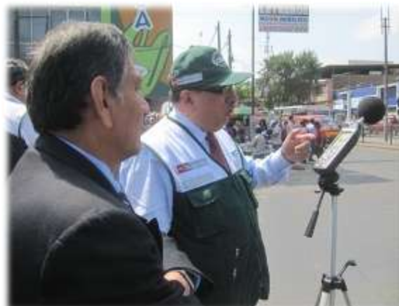
OPERATIVO DE CONTAMINACIÓN ACÚSTICA – PARTICIPACIÓN DE LA OEFA (13/07/11)