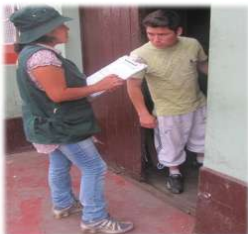
Figura N° 066