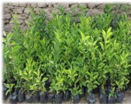
PLANTAS DE NARANJA (25/11/11)