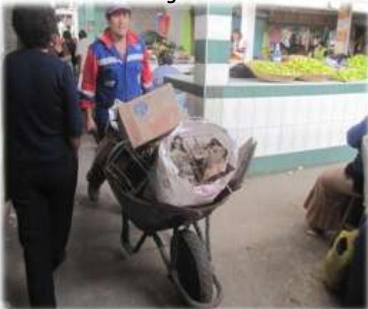
Figura N° 054