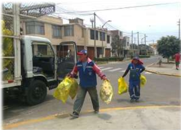
Figura Nº 035