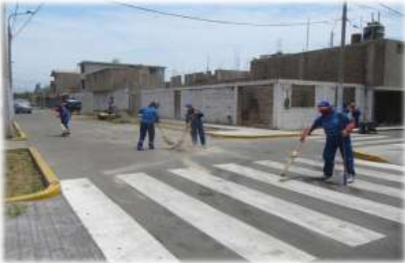
SERVICIO REALIZADO EN LA URB LOS PINOS (06/02/11)