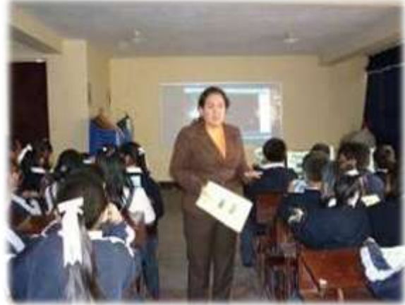
I.E. N°81004 "LA UNIÓN" (07/09/2011)