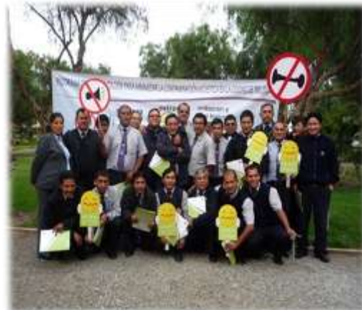
SENSIBILIZACIÓN Y CAPACITACIÓN DIRIGIDA A CONDUCTORES (17/08/11)