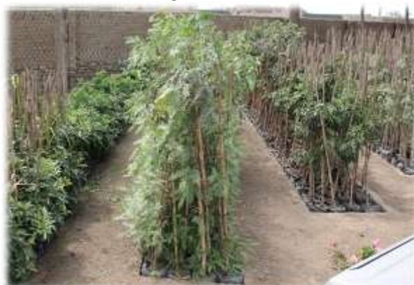
Figura N° 028