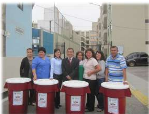
ENTREGA DE TACHOS DE SEGREGACIÓN AL CONDOMINIO PUERTA DEL MAR (16/11/11)