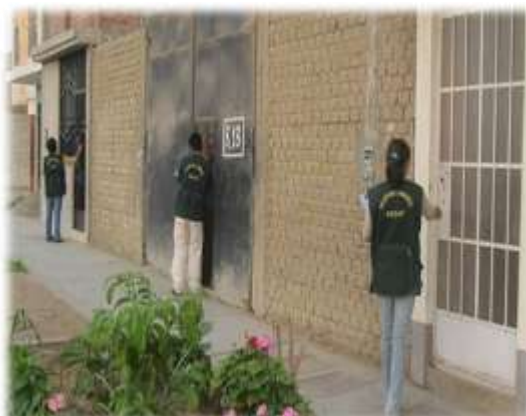
Figura N° 064