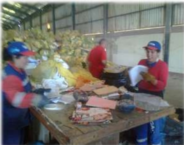
Figura Nº 037