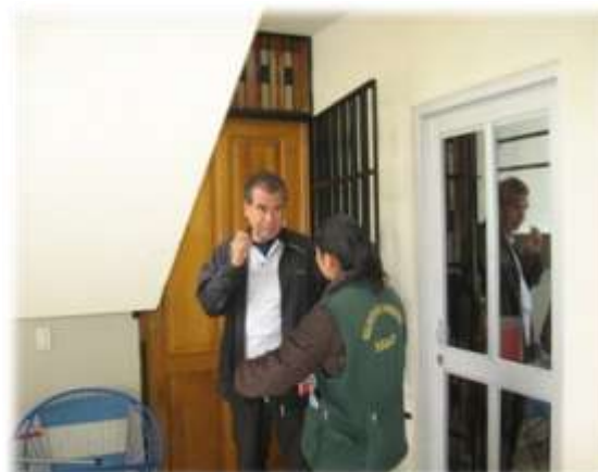
SENSIBILIZACIÓN REALIZADA EN EL CONDOMINIO PUERTA DEL MAR (14/09/11)