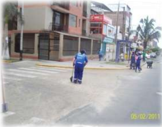
CAMPAÑA DE URB. LOS PINOS (05/02/11)