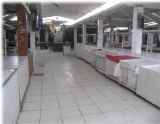
BALDEADO DE INTERIORES MERCADO MAYORISTA (14/09/11)