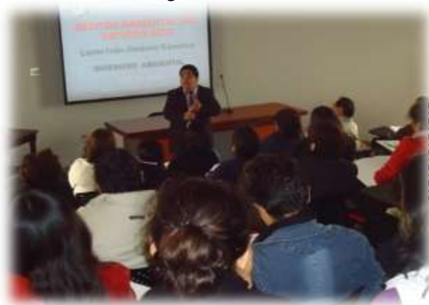
Figura N° 080