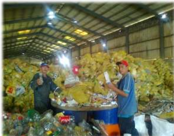
MATERIAL SEGREGADO (29/10/11)