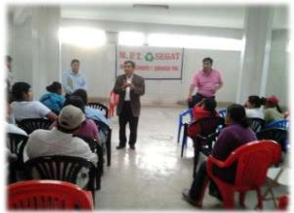
CAPACITACIÓN A RECICLADORES INFORMALES (18/11/11)