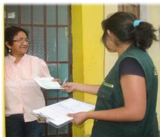
SENSIBILIZACIÓN REALIZADA EN JR LA UNION (26/01/11)