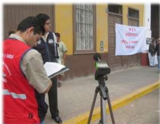
OPERATIVO DE CONTAMINACIÓN ACÚSTICA (14/05/11)