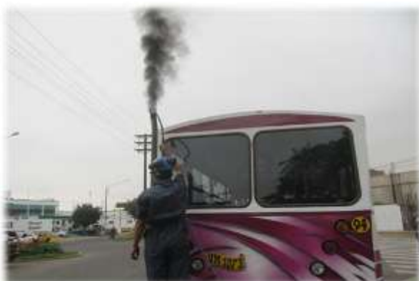
OPERATIVO DE CONTAMINACIÓN POR GASES (14/06/11)