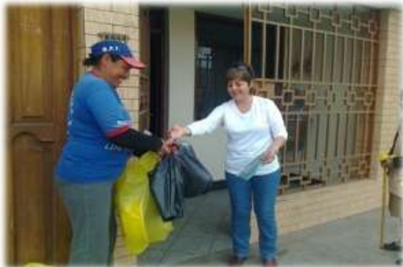
Figura Nº 033