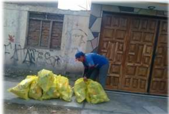
RECOLECCIÓN DE MATERIAL SEGREGADO (27/10/11)