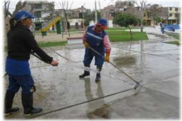
SERVICIO DE BALDEO REALIZADO EN EL PARQUE COVICORTI (06/10/11)