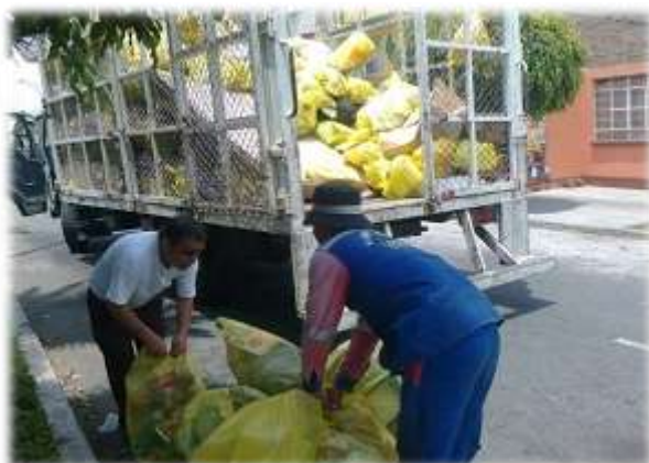
TRANSPORTE DE MATERIAL SEGREGADO (27/10/11)