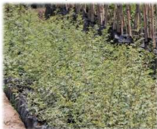
PLANTAS DE ALGARROBO (25/11/11)