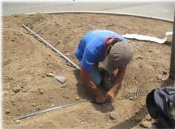
Figura N° 021