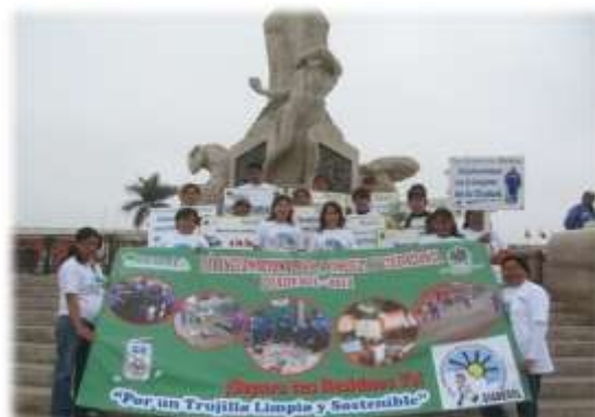
DIADESOL - PASACALLE (20/09/11)