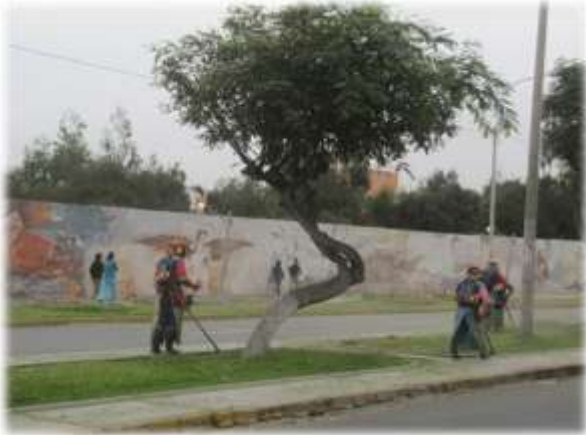
SERVICIO PODA REALIZADO EN LA AV. JUAN PABLO II (26/05/11)