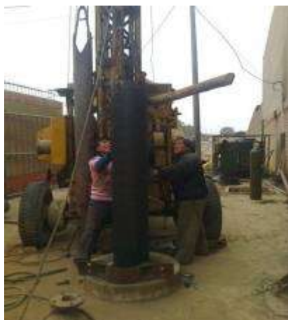
Figura N° 023