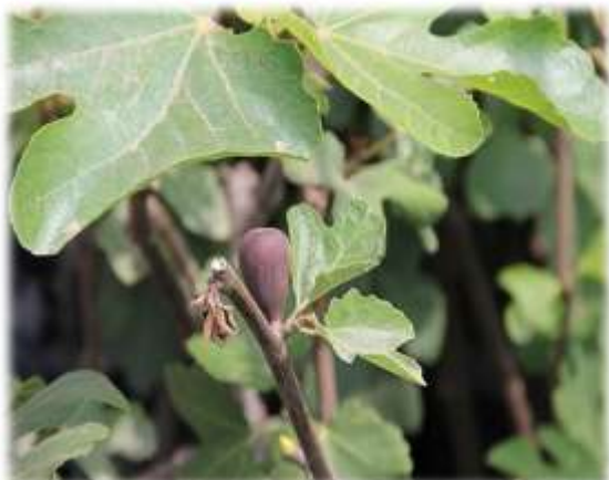
PLANTAS DE HIGO (25/11/11)