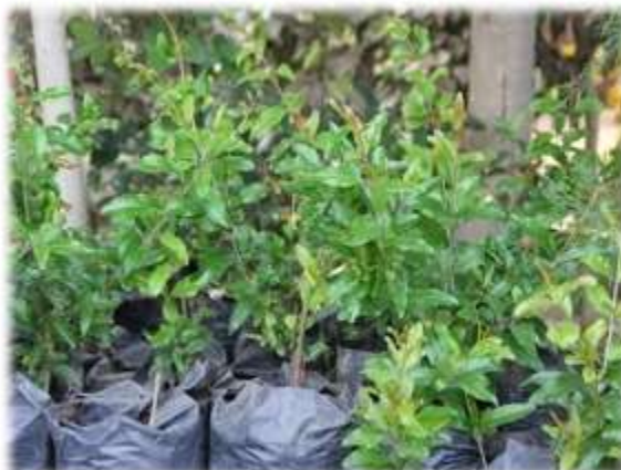
PLANTAS DE GRANADA (25/11/11)