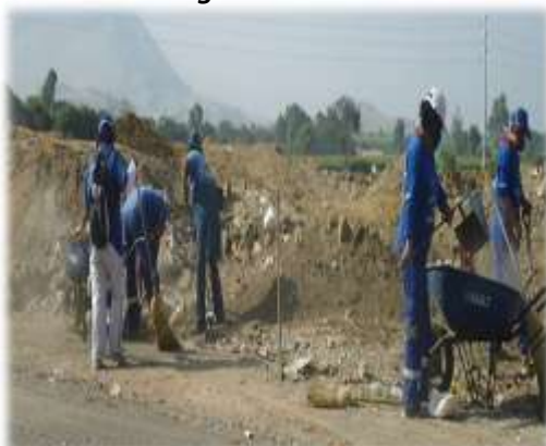
Figura N° 068