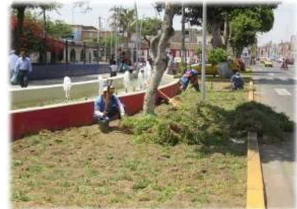
Figura Nº 016