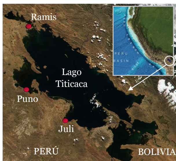
Figura 1. Localización de las estaciones limnológicas del IMARPE en el Lago Titicaca. Los mapas base y en el recuadro se adaptaron de NASA y de GEBCO (2014).

El Reporte Diario de la Temperatura Superficial del Agua en el Lago Titicaca es un producto de la Dirección General de Investigaciones Oceanográficas y Cambio Climático (DGIOCC) y del Laboratorio Descentralizado de Puno, ambos del Instituto del Mar del Perú (IMARPE). El Reporte tiene el propósito de informar a las sociedad de las variaciones diarias de la temperatura superficial del agua del lago Titicaca en las estaciones limnológicas que administra el IMARPE en las localidades de Puno, Juli y Ramis.