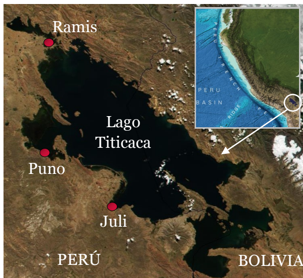
Figura 1. Localización de las estaciones limnológicas del IMARPE en el Lago Titicaca. Los mapas base y en el recuadro se adaptaron de NASA y de GEBCO (2014).

El Reporte Diario de la Temperatura Superficial del Agua en el Lago Titicaca es un producto de la Dirección General de Investigaciones Oceanográficas y Cambio Climático (DGIOCC) y del Laboratorio Descentralizado de Puno, ambos del Instituto del Mar del Perú (IMARPE). El Reporte tiene el propósito de informar a las sociedad de las variaciones diarias de la temperatura superficial del agua del lago Titicaca en las estaciones limnológicas que administra el IMARPE en las localidades de Puno, Juli y Ramis.