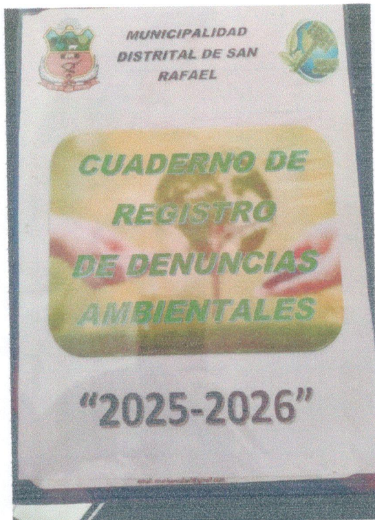
Imagen Nº 01