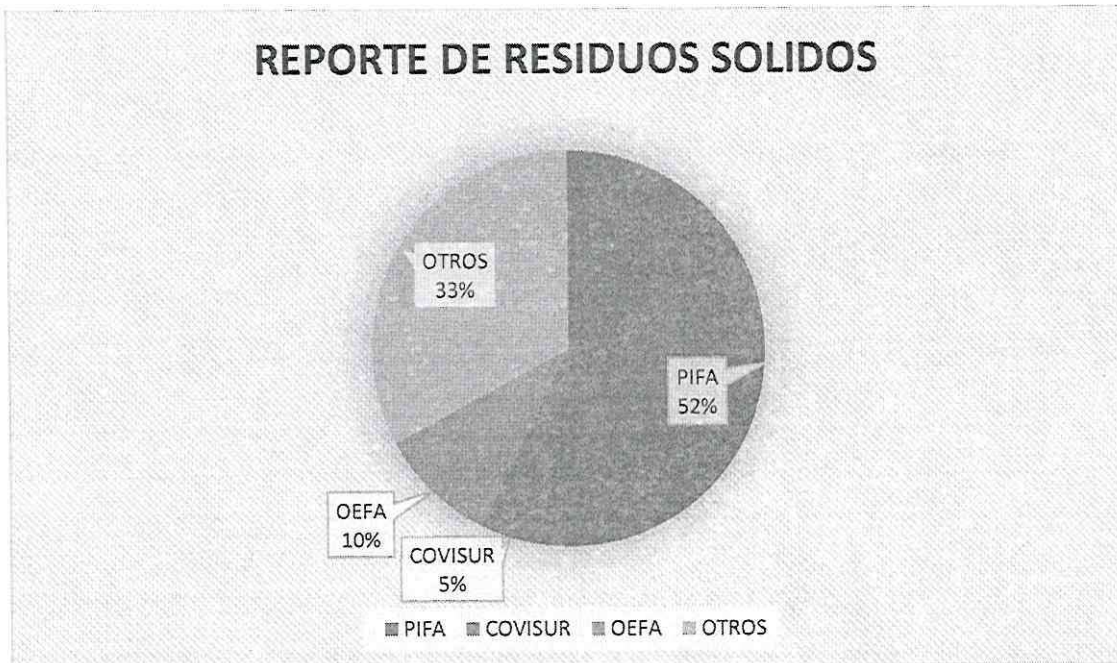
GRAFICO N°01: Quejas y denuncias ambientales.

Es importante señalar que se han dado por "Atendidos" 61 casos (100%) y 0 casos (0%) se encuentran en "Seguimiento", según el detalle descrito en la siguiente tabla: