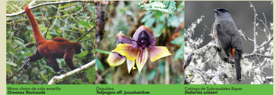
Mono choro de cola amarilla Oreonax flavicauda

Esta zona se destaca por ser un lugar donde se conservan los bosques de manera rigurosa y estricta, por ser refugio de aves como el Tororojizo, la Cotinga de Subcaudales Bayas, la Tangara de Montaña de Dorso Dorado, Tangara de Bufanda Amarilla y Hemispingo de Ceja Rufa; animales silvestres como el Mono Choro de Cola Amarilla, Oso de Anteojos y el Zorro Colorado. Además alberga especies de flora silvestre como: orquídeas de gran importancia para el departamento de Huánuco, el árbol de la quina, plantas de incienso y romerillo.