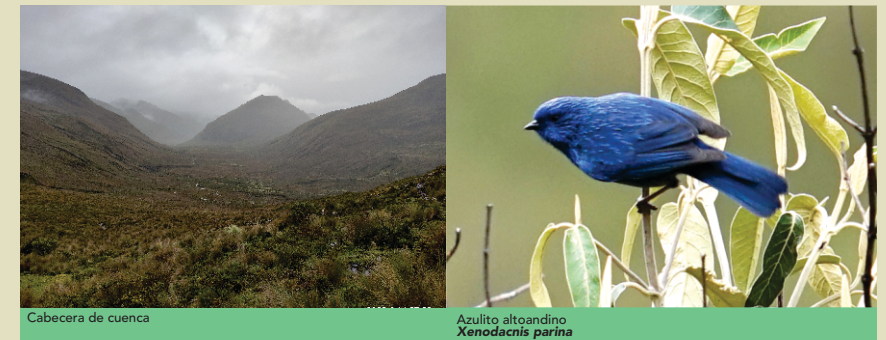
Cabecera de cuenca

Se ubica al noroeste de la propuesta de ACR Yanajanca. Esta zona destaca por ser un lugar donde se conservan en su mayoría los páramos de manera rigurosa y estricta, por ser refugio de aves como el Azulito Altoandino, Vencejo de Collar Blanco, Colibrí Cobrizo, Ave Fria Andina, Carpintero Andino, Caracara Cordillerano y el Cucarachero sabanero.