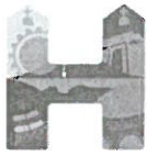
Cuadro 09. Identificación de Impactos Socio económicos