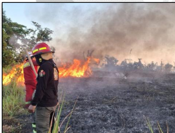
Incendio forestal en el distrito de Campo Verde