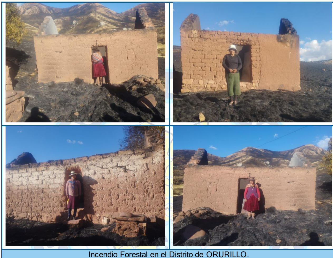
Incendio Forestal en el Distrito de ORURILLO.