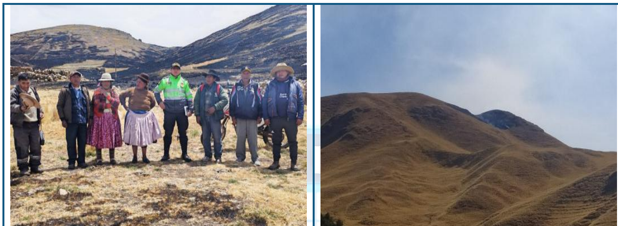
Incendio Forestal en el Distrito de ORURILLO.