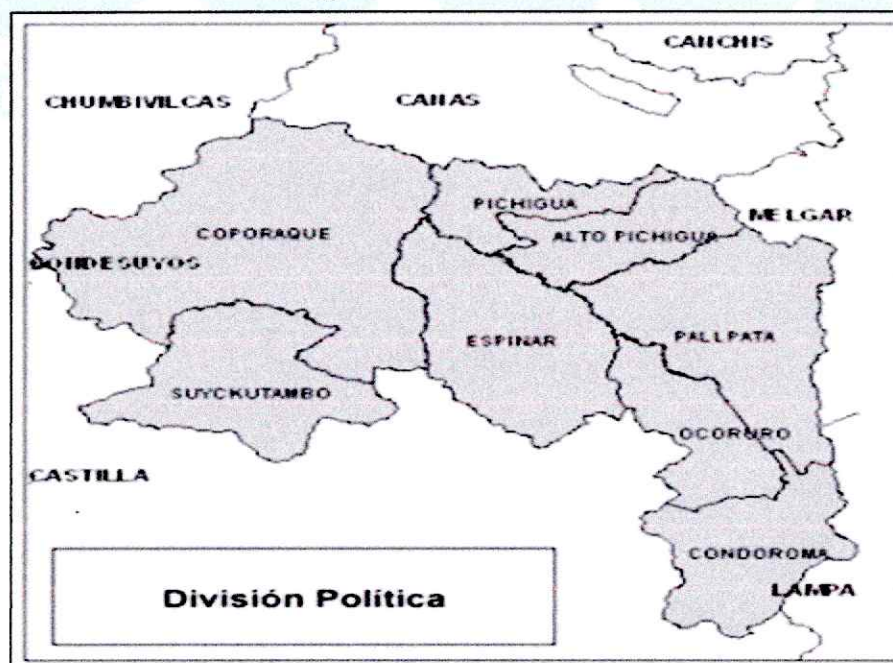
Figura 2. División Política

Su superficie, abarca una extensión de 5,311.09 km 2 . Políticamente, la demarcación territorial interna de la provincia, está constituida por ocho distritos: Alto Pichigua, Condorama, Coporaque, Espinar, Ocoruro, Pallpata, Pichigua y Suykutambo.