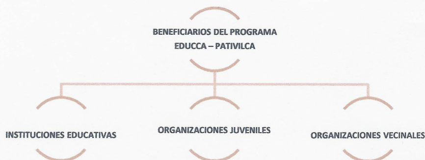
Figura 1. Beneficiarios.

El Programa Municipal EDUCCA del distrito de Pativilca, es un instrumento municipal de planificación y gestión para la implementación de la Política Nacional de Educación Ambiental a nivel local, que incluye acciones de promoción cultural y ciudadanía ambiental, a través de la participación activa, del acceso a la información y justicia ambiental a diferentes niveles de intervención. Bajo este marco, el programa EDUCCA contará con los siguientes beneficiarios (Figura 1):